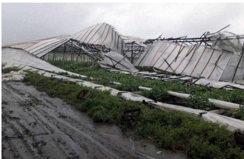
Figura 4: Destrozos de la tormenta del 2019

Retomando los testimonios de los productores entrevistados, ninguno reconoció algún tipo de ayuda por parte del Estado luego de la tormenta de 2019.