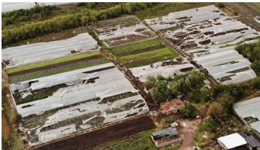
Figura 3: Destrozos de la tormenta del 2017

Sin embargo, los entrevistados con quienes se tuvo contacto sólo reconocieron la entrega de 4 rollos de nylon por productor, algunas chapas y pocas maderas y, a su vez, enunciaron que a los créditos solo pudieron acceder los grandes productores.