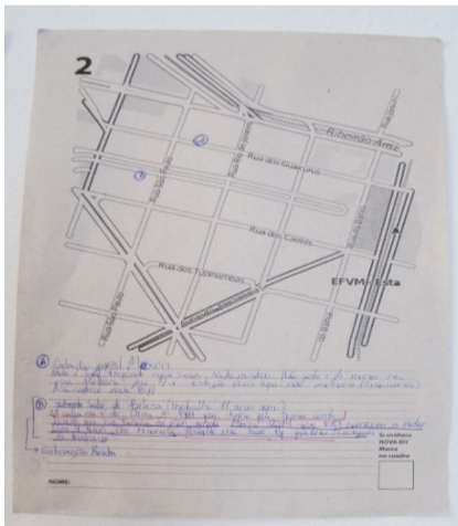
Imagen 1. Mapa del centro de la ciudad de Belo Horizonte intervenido por un asistente al taller

Para ilustrar mejor los procedimientos llevados a cabo por Iconoclastas, comenzaremos focalizando una de estas experiencias que, pese a estar situada en un contexto extranjero, permitirá identificar la trama de reflexiones en torno al territorio.