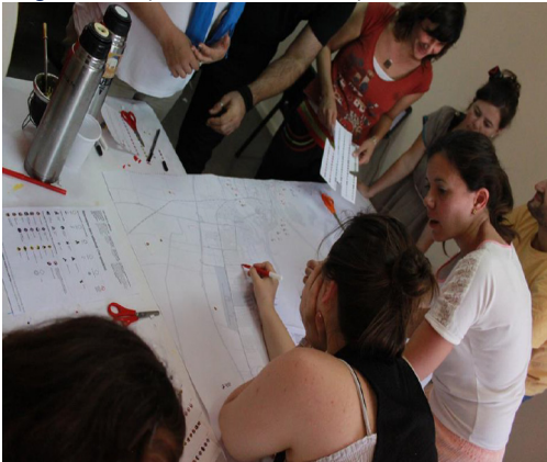
Imagen 3. Participantes en el taller de mapeo en Santa Fe