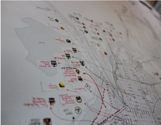
Imagen 2. Mapa del área metropolitana de Santa Fe realizado en la jornada de Iconoclasistas

están desplegándose hoy; y un primer organizador de temáticas para convocar al diálogo y la construcción a diferentes organizaciones y colectivos sociales de la región. Este primer mapeo colectivo es también la base de inicio de una escuela de saberes socio-ambientales que el colectivo Tramatierra y el sindicato ADUL buscan construir como lugar formativo para el pensamiento y la acción en temas vinculados al territorio y la ciudadanía (Iconoclasistas, s.f.).