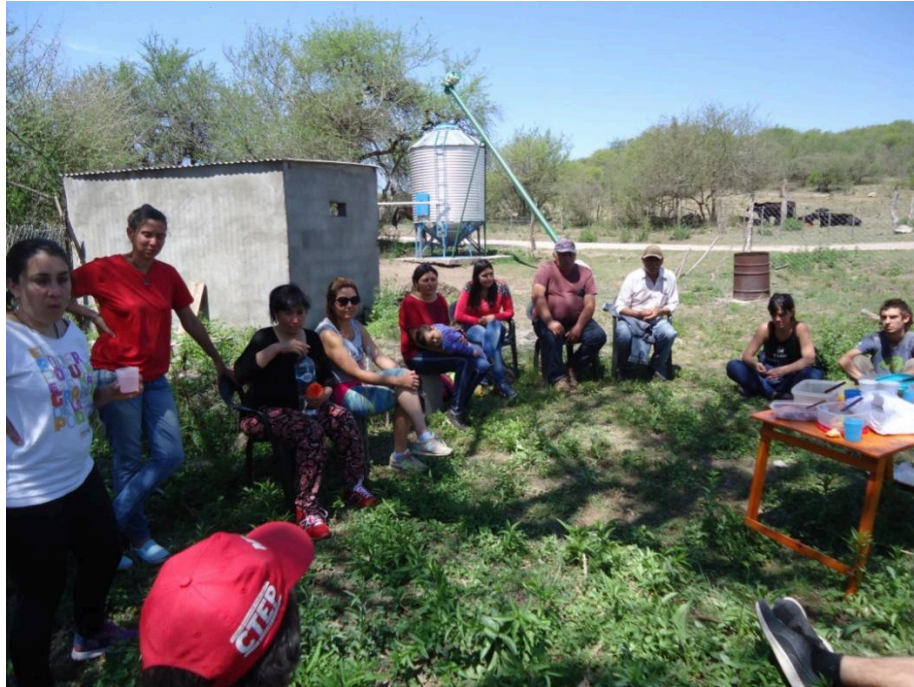
Figura 2: foto del primer encuentro