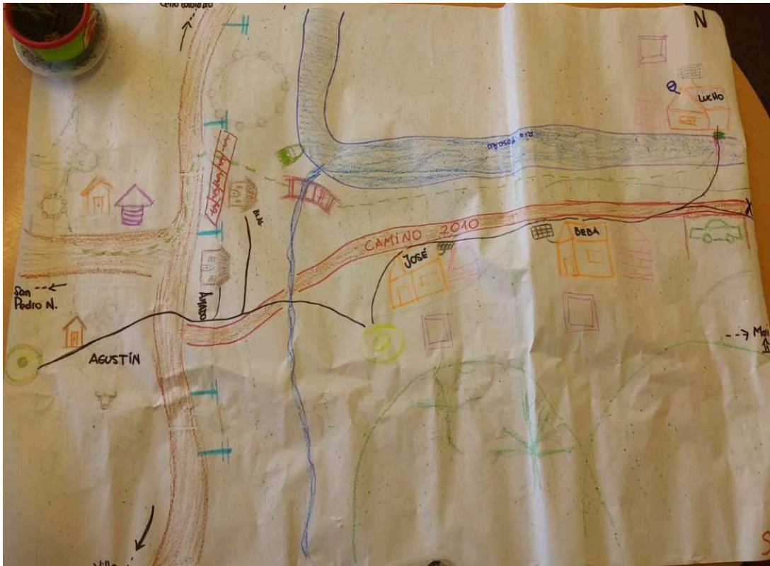
Figura 3: Mapeo colectivo -sin mapa base- realizado por los estudiantes