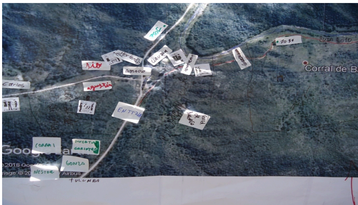
Figura N° 5: Cartografía social de la comunidad de Yosoro

La confrontación del espacio vivido con la imagen, fue revelador para ambas partes, permitiendo la complementariedad en la visión del espacio, integrando conocimientos que revelaron nuevas perspectivas de abordaje del entramado territorial.