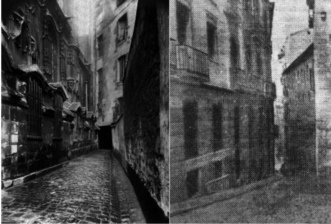
FIGURA 1 - Díptico II - Antiguo Osario / El color de Madrid (2da parte)

Fuente: Eugène Atget, < http://www.atgetphotography.com/The-Photographers/Eugene-Atget.html >, Eglise Saint-Gervais, Paris, 1899 / Roberto Arlt, El Mundo , p. 14, 31 ene. 1936.