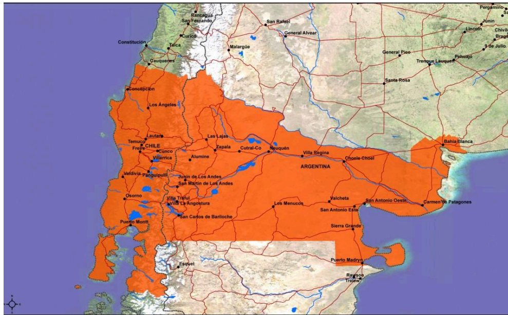
Gráfico 4: Corredor bioceánico de la Patagonia