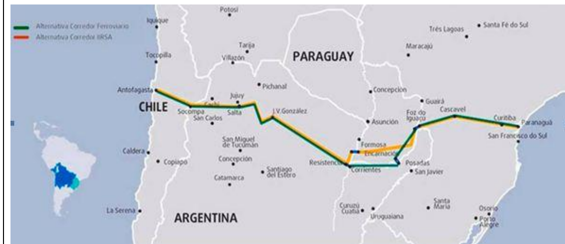
Gráfico 2: Corredor de Capricornio