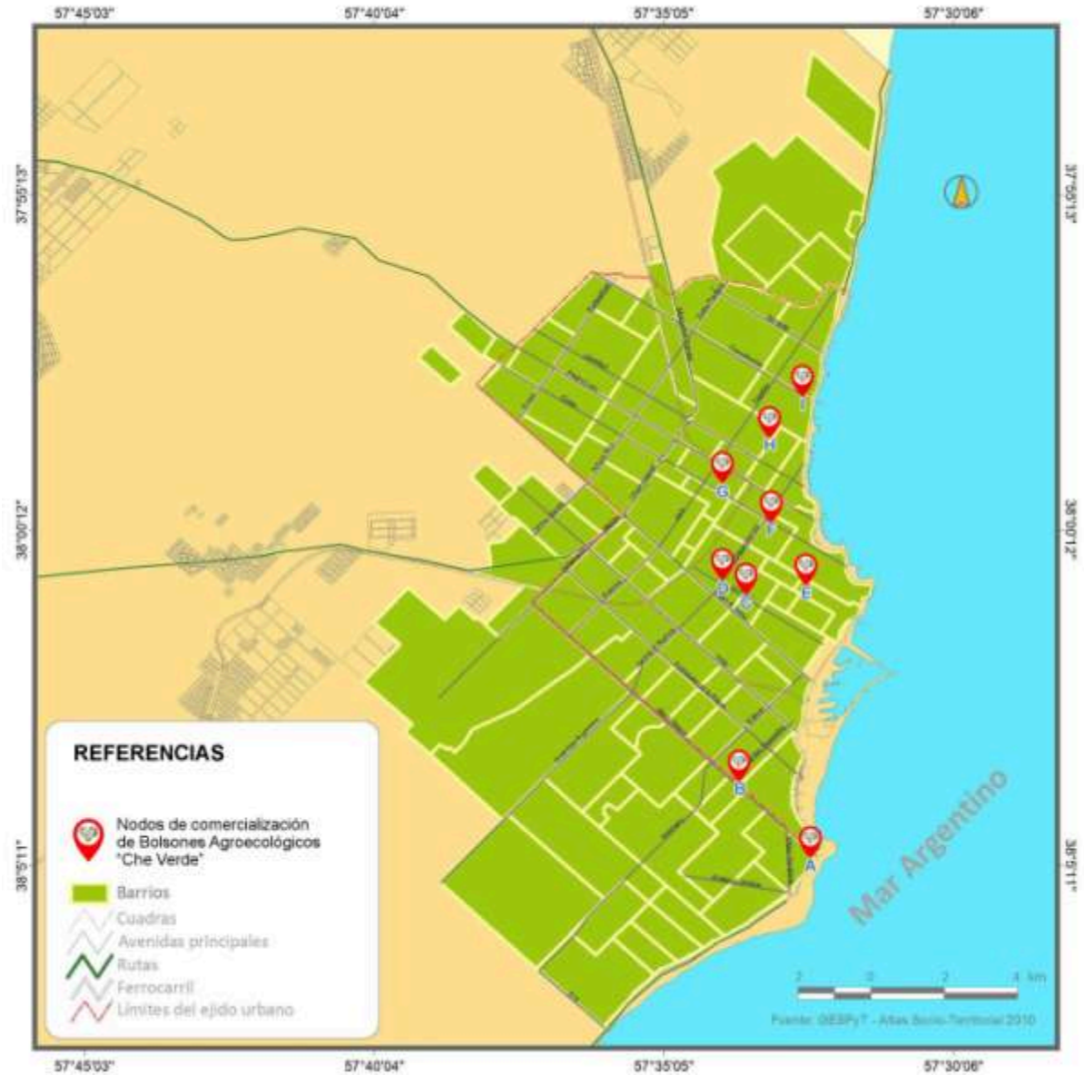
Figura N° 5 - Nodos de Comercialización de Bolsones Agroecológicos Che Verde en ciudad de Mar del Plata (Partido General Pueyrredón)