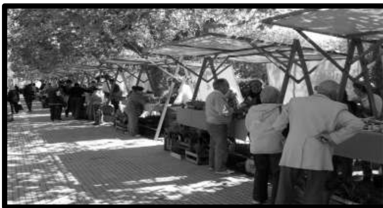
Figura N° 2 - Feria Verde Agroecológica en Plaza Rocha, ciudad de Mar del Plata