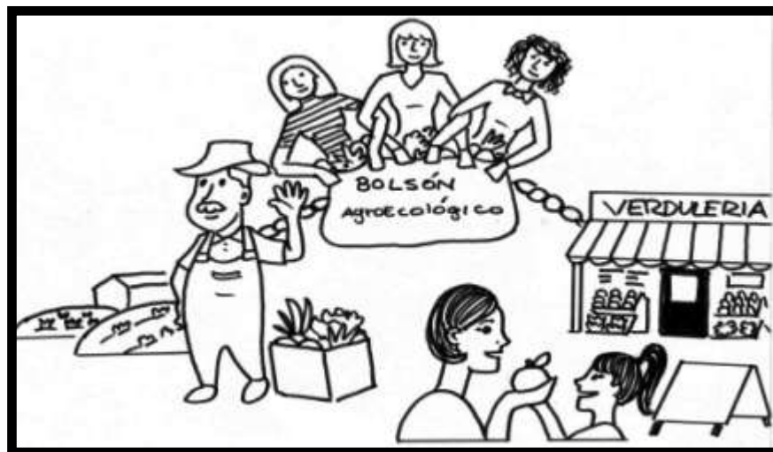
Figura N° 4 - Canal de Comercialización de Productos Agroecológicos

Fuente: ilustrador Juan Francisco García