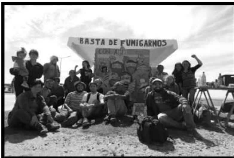
Figura N° 3 - Garita de colectivo en barrio Félix U. Camet