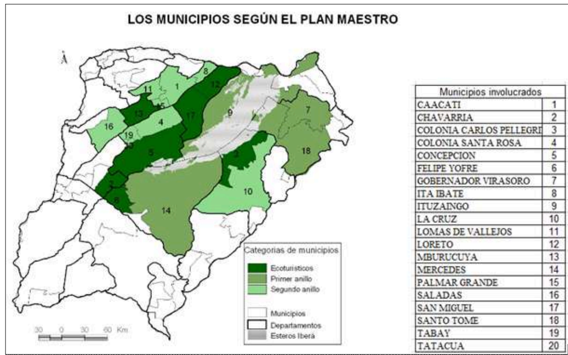
Figura 2. Los municipios según el Plan Maestro

proyecto consolida los procesos de reterritorialización asociados al ecoturismo, inicialmente promovidos desde el Plan de Manejo y la multiterritorialidad de quienes lo impulsan.