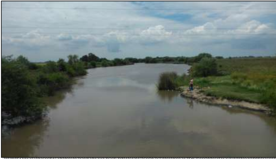
Figura 4: Vista del Arroyo El Pescado desde el puente de calle 30.