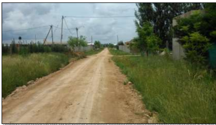
Figura 3: Trazado de calles como parte de la expansión urbana en Villa Garibaldi.