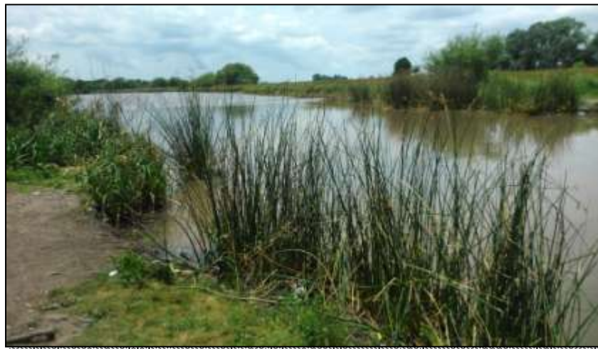
Figura 5: Vera del arroyo El Pescado.