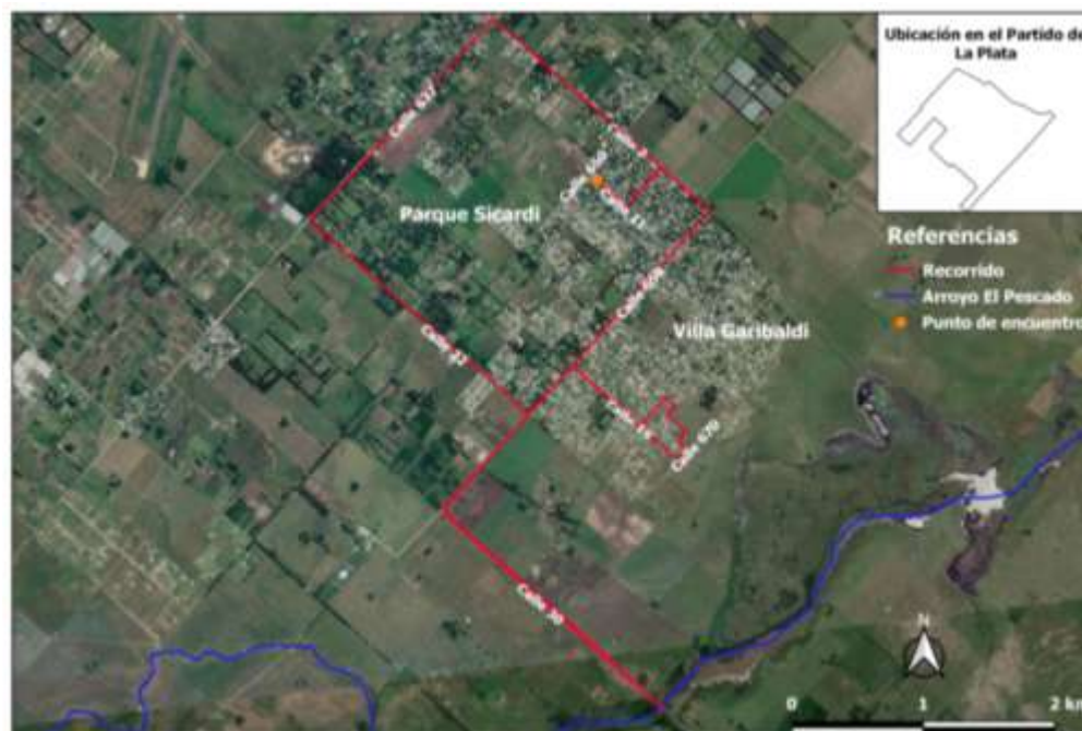
Figura 2: Recorrido realizado en la salida de campo