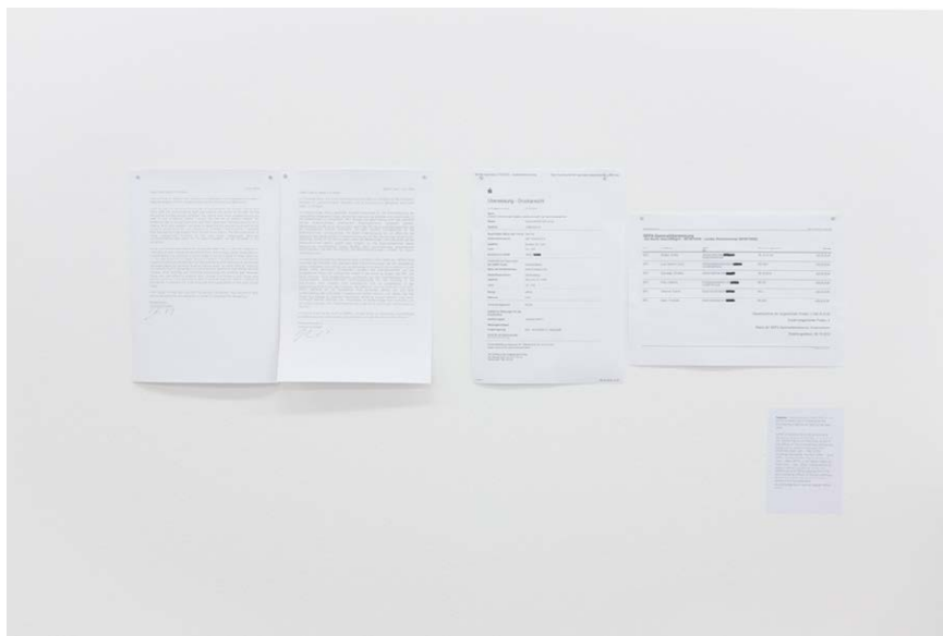
Figura 3. Subsidy (2015), de Joshua Schwebel. Pormenor da instalação. Foto: Sandy Volz. Cortesia do artista

Não só foi importante a mudança para o espaço da galeria, como foi importante o processo inverso, o de deslocalização do escritório original, apontando neste para a ausência do estagiário. Interrompeu os circuitos habituais, tanto para os outros trabalhadores da Künstlerhaus Bethanien, como para os artistas, dado que algumas funções não puderam ser realizadas no espaço expositivo. Relembrou ainda a necessidade do trabalho e da presença do estagiário, tomada por garantida e subvalorizada.