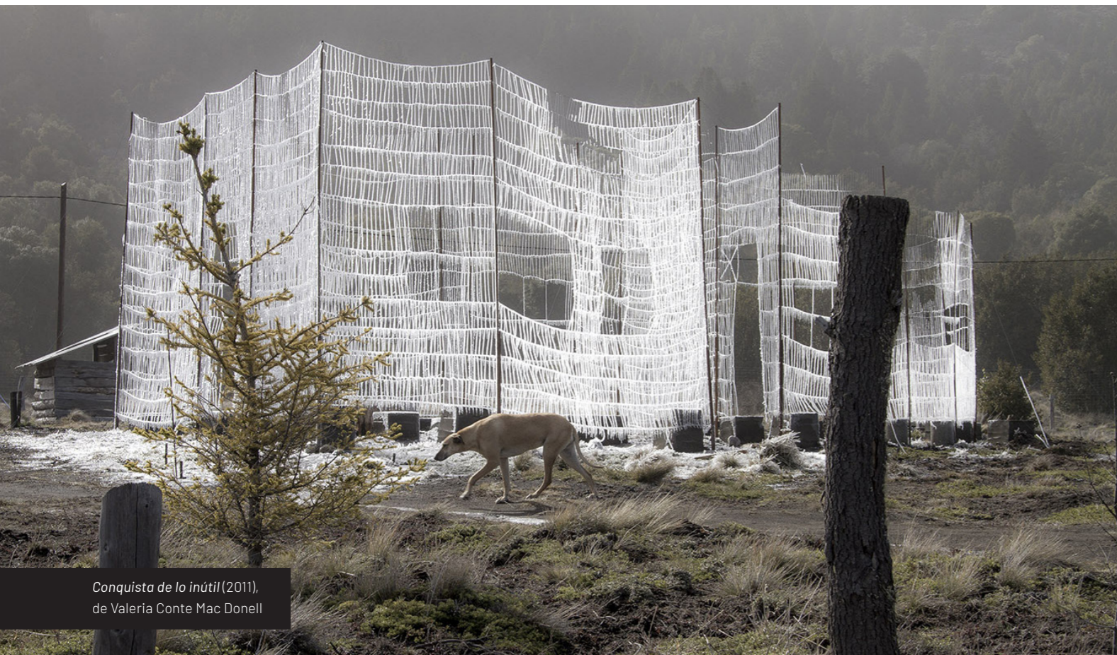
Conquista de lo inútil (2011), de Valeria Conte Mac Donell