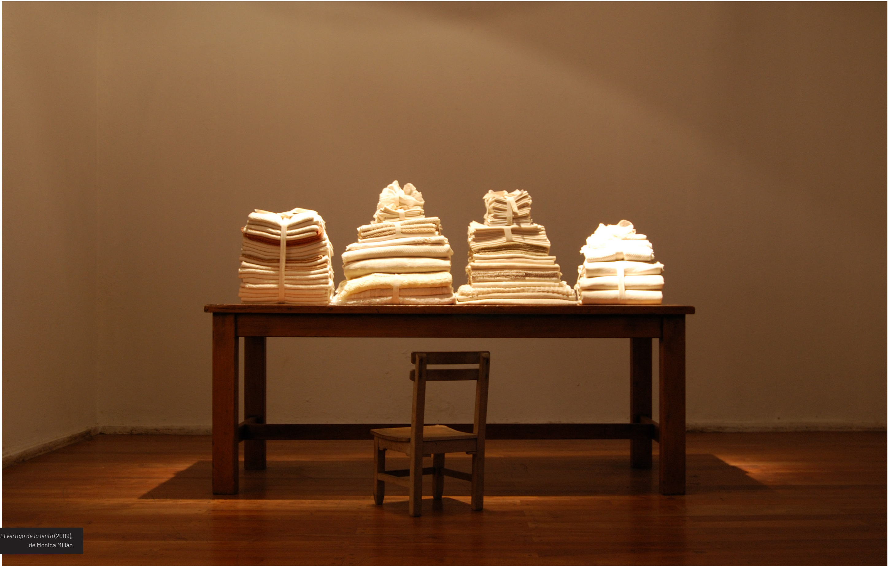
El vértigo de lo lento (2009), de Mónica Millán