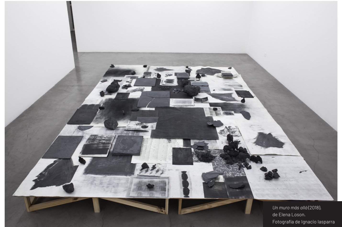
Un muro más allá (2018), de Elena Loson. Fotografía de Ignacio lasparra

1 Extracto del poema escrito por Max Gomez Canle a propósito de la exposición Un muro más allá , de Elena Loson en Galería Hache, en 2018.