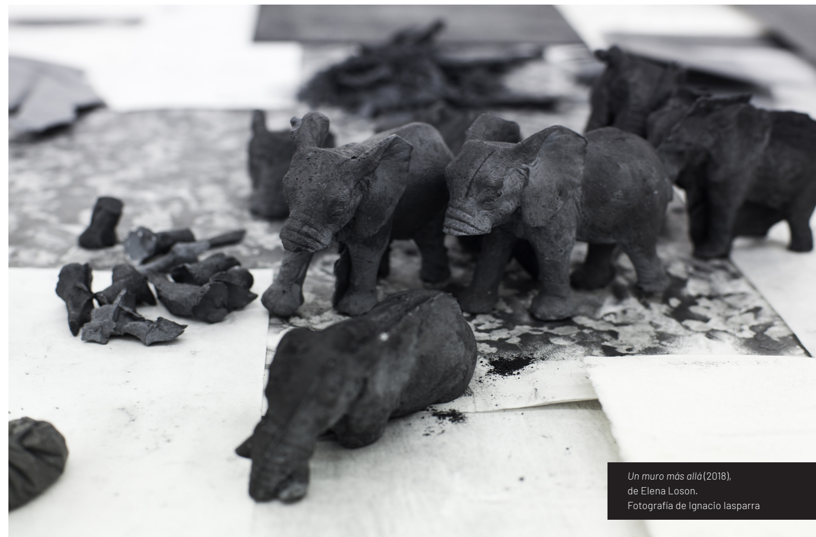
Un muro más allá (2018), de Elena Loson. Fotografía de Ignacio Iasparra