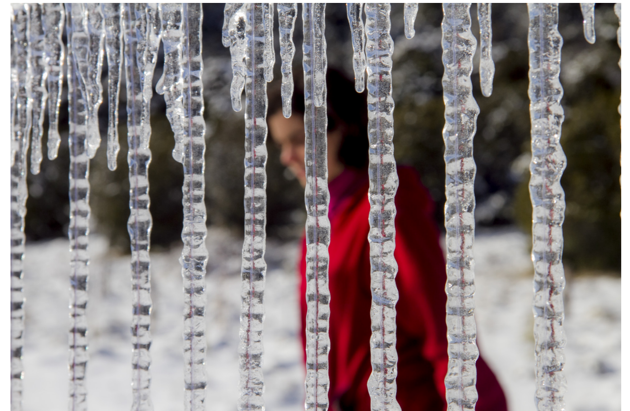
Conquista de lo inútil (2011), de Valeria Conte Mac Donell