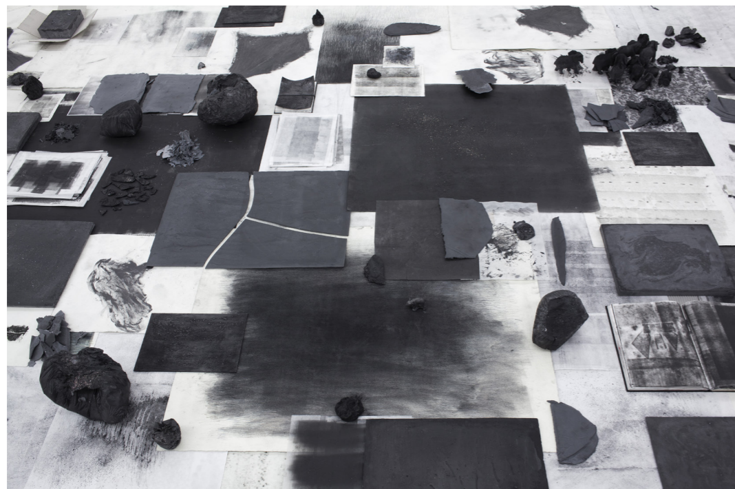
Un muro más allá (2018), de Elena Loson. Fotografía de Ignacio Iasparra