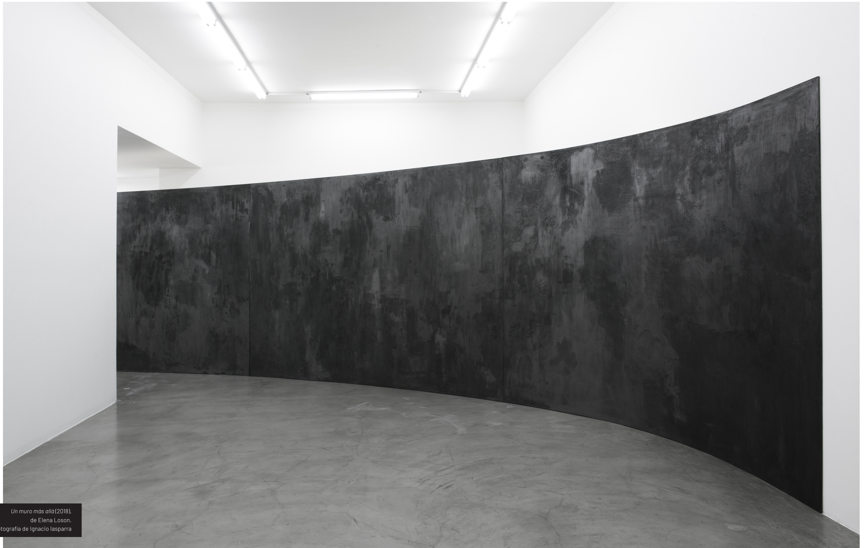
Un muro más allá (2018), de Elena Loson. Fotografía de Ignacio Iasparra