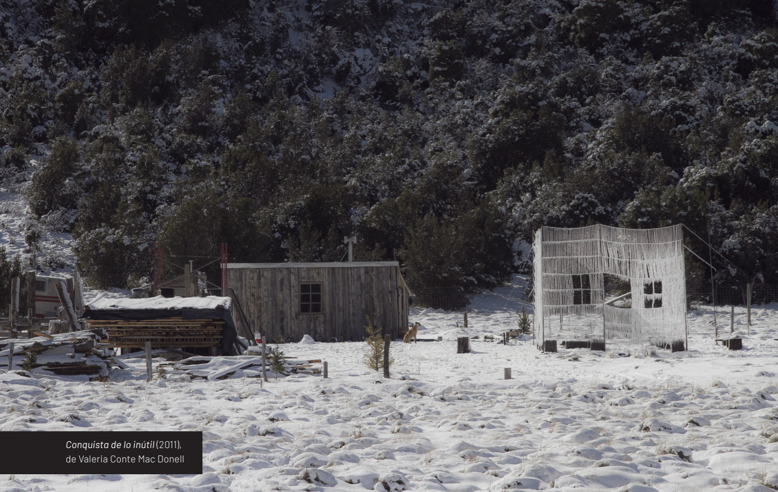
Conquista de lo inútil (2011), de Valeria Conte Mac Donell