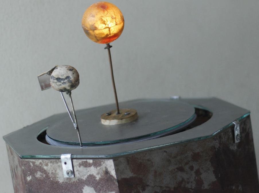
Figura 2. Luna (2019), de Santiago Colombo Migliorero

Medir el tiempo [Figura 3] funcionaba como una traslación de la morfología de un reloj, al desplazar su funcionalidad hacia el terreno de lo absurdo, para generar un nuevo sentido en las coordenadas dadas por sus agujas. Esta traslación hacia lo topográfico intentaba encontrar en el reloj y, por analogía, en el tiempo, una medida espacial que le diera, en cierta forma, cuerpo a algo tan inasible.