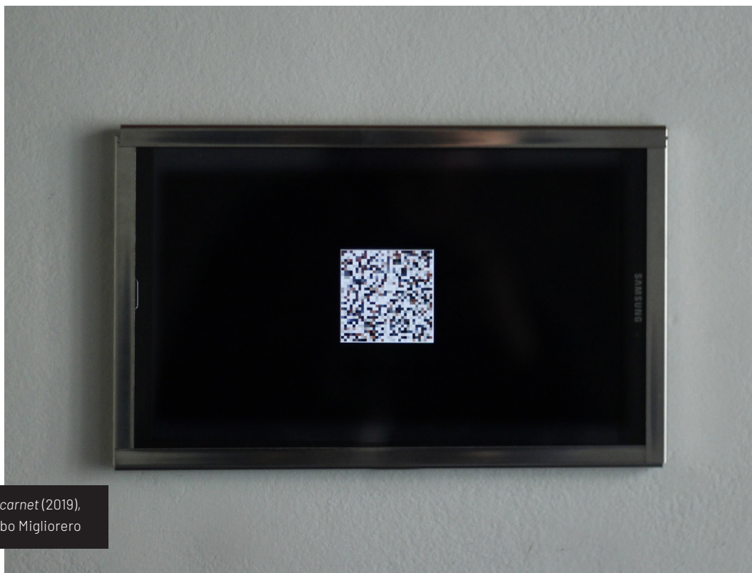
Figura 4. Foto carnet (2019), de Santiago Colombo Migliorero

—de 32 x 32 píxeles— fueran reacomodados una vez por segundo. De esta forma, estadísticamente, la imagen original solo se formaría durante un segundo cada 5,418528 E+2639 años, es decir, mucho más que la edad estimada del universo conocido. ¿Es mi yo actual fruto de casualidades e iteraciones? ¿Podría la imagen original formarse por mero azar rompiendo momentáneamente la entropía natural de la obra?