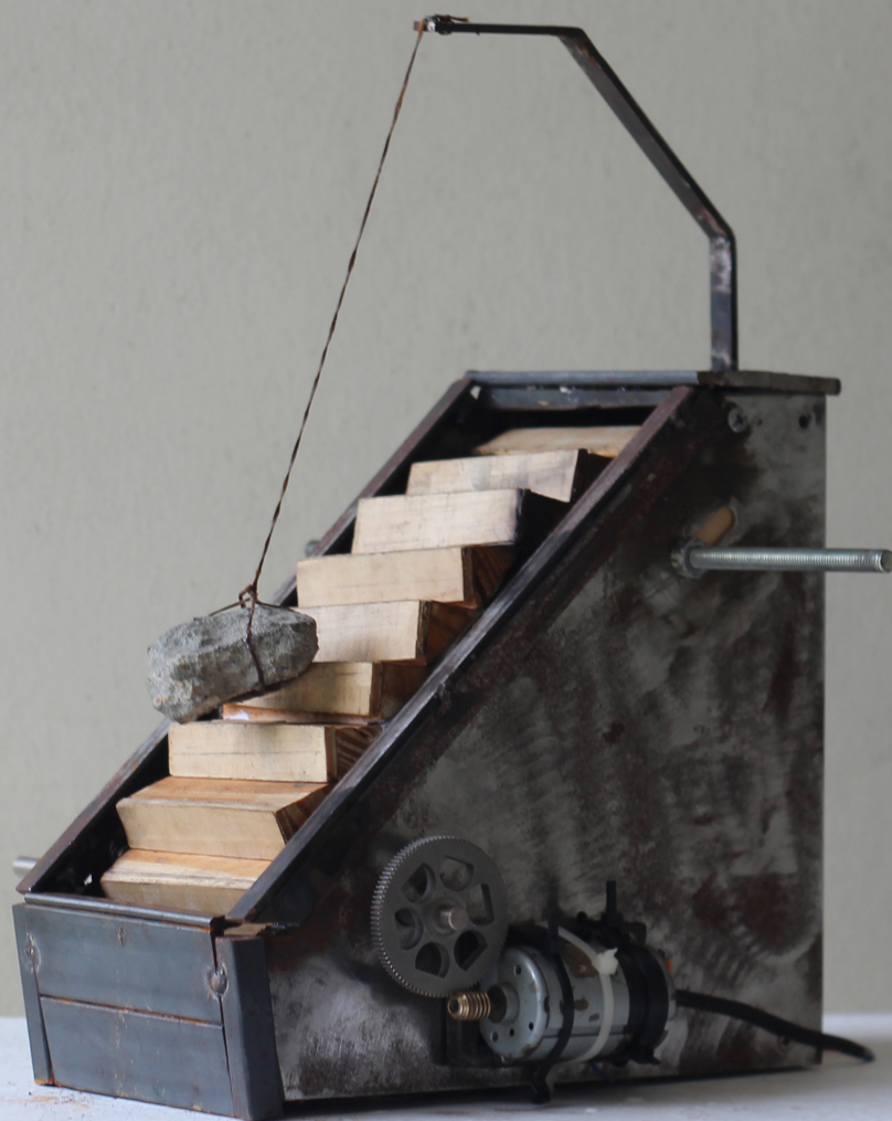
Figura 5. Sin título (2019), de Santiago Colombo Migliorero