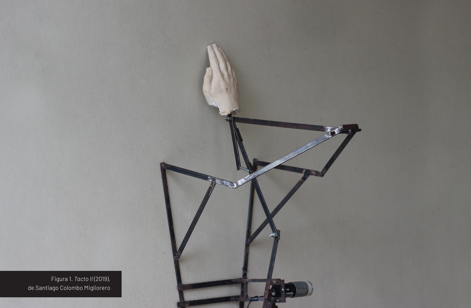
Figura 1. Tacto II (2019), de Santiago Colombo Migliorero