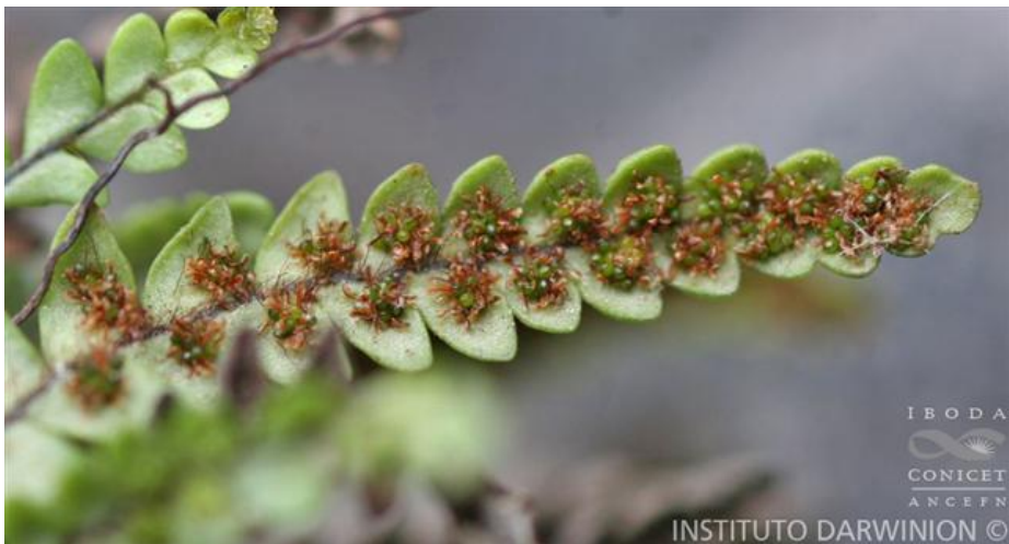
Fotos 1 y 2. Melpomene peruviana .