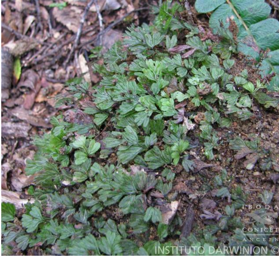
Foto 1. Hymenophyllum tubrigense .

Género con cerca de 300 especies de distribución pantropical, aunque algunas se encuentran en lugares templados y húmedos. Para la Argentina Ponce (1996) cita 16 especies, la mayoría creciendo en los bosque andino-patagónicos. En el valle de Lerma se encuentra presente solamente una, con una variedad.