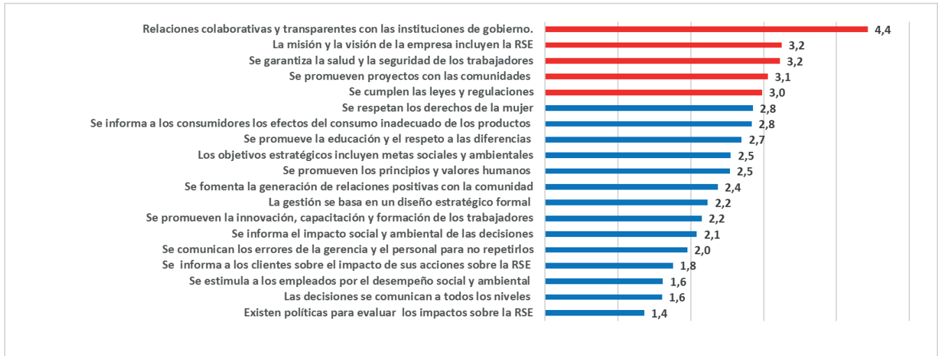
Gráfico N° 1: Valoración de la gestión de la dimensión social de la RSE en empresas industriales de la Ciudad de Santa Cruz de la Sierra (Escala Likert 1-6)