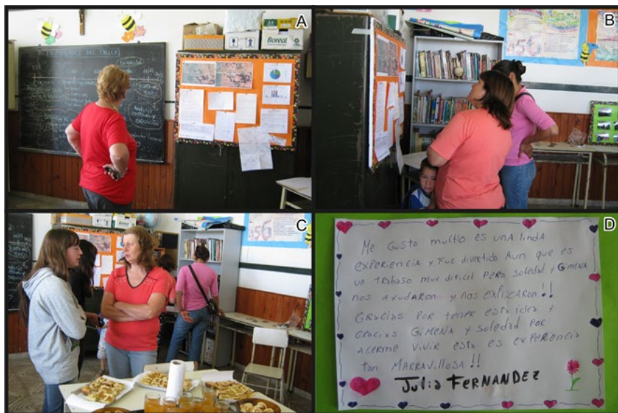
Figura 3. Muestra de las actividades realizadas; a, b y c: comunidad participando de la muestra; d: devolución de una estudiante.

Por último, se acordó realizar una charla con personas de la Asociación Amigos del Tren de Bartolomé Bavió, quienes han realizado muchas investigaciones acerca del paso del tren en las localidades del partido. Los estudiantes escucharon atentamente, realizaron preguntas y manifestaron sus inquietudes.