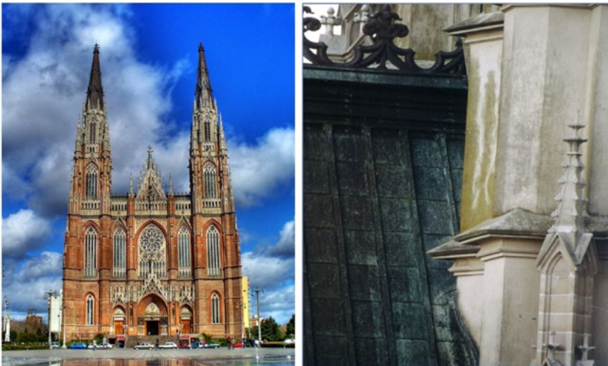
Figura 2. Catedral de La Plata, Argentina (izq.). Pátina natural de cobre (der.)