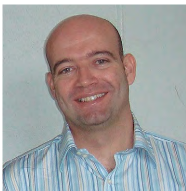
ENTREVISTA: VICENTE RAMOS

ENTRE EL 3 Y EL 7 DE SEPTIEMBRE SE DESARROLLÓ EN LA FACULTAD LA SÉPTIMA CONFERENCIA DE LA ASOCIACIÓN INTERNACIONAL PARA LA ECONOMÍA DEL TURISMO (IATE). EN DIÁLOGO CON ECONO, EL ECONOMISTA, ACADÉMICO DE LA UNIVERSIDAD DE LAS ISLAS BALEARES (ESPAÑA) Y EX VICEPRESIDENTE DE LA ASOCIACIÓN INTERNACIONAL PARA LA ECONOMÍA DEL TURISMO, ANALIZÓ EL PRESENTE DEL SECTOR Y LOS DESAFÍOS A FUTURO.