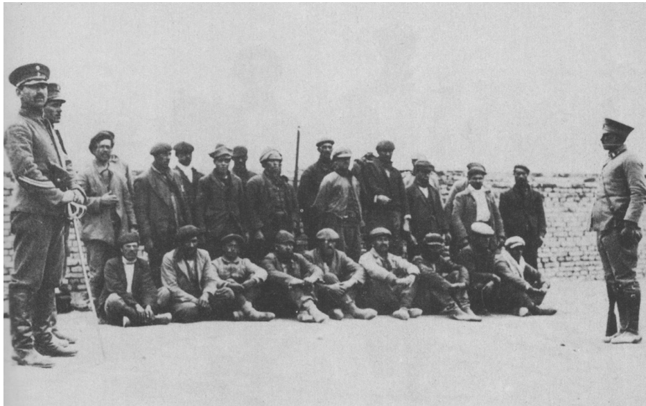
Figura 1. Huelguistas sindicados como cabecillas en la prisión de Puerto San Julián (Imagen retocada de Bayer 1993).

La presión ejercida por los estancieros condujo a que se enviara nuevamente al Regimiento 10° de Caballería al mando de Varela, quien al desembarcar declaró la Ley Marcial. Primero se concentró en la zona sur y luego se trasladó al norte, para dar por terminada la huelga en todo el territorio de Santa Cruz a comienzos de enero de 1922. Durante su campaña se fusilaron entre 500 y 1500 obreros rurales (Bayer, 1972b), mientras un número no determinado de huelguistas o personas sospechadas de ser afines al movimiento obrero fueron apresados durante meses en cárceles de Puerto San Julián (Figura 1) y Río Gallegos, en condiciones infrahumanas. Posteriormente, todos ellos fueron dejados en libertad sin cargos.