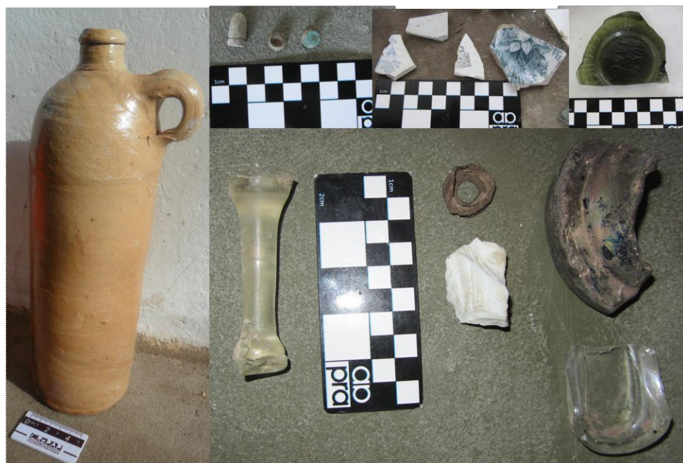
Figura 3. Restos materiales recuperados en el terreno próximo a las ruinas de la casa de Rómulo Franco. Una de las botellas de ginebra holandesa, metal, vidrio y loza, entre otros elementos.

Con respecto a otros elementos recuperados sobre el terreno, actualmente depositados en la sala de interpretación de la isla, deben mencionarse la base de una botella de vidrio verde gruesa; un fragmento de asa similar a las botellas de gres mencionadas previamente; ocho fragmentos de base, cuello y cuerpo de pequeñas botellas de g color crema, doce fragmentos de loza inglesa correspondiente a cuatro tipos distintos (dos del tipo azul sobre blanco, uno verde sobre blanco y otro rojo oscuro sobre blanco), un frasco de porcelana incompleto, un cuello de frasco de porcelana; dos fragmentos de vidrio grabado con diseño floral, un fragmento de cuello de vidrio alargado; entre otros restos vítreos transparentes, azules y violetas. También se recuperaron elementos de metal, como un dedal, arandelas o aros, balas y casquillos de proyectil (Figura 3). Con respecto a los fragmentos de botellas de gres monocromas lisas color crema, corresponden a los envases de cerveza de forma sinusoidal que circularon a partir de la segunda mitad del siglo XIX, en uno de ellos se alcanza a observar parte de un sello circular en el que se observan las letras “NEDY”, las cuáles podrían corresponder a la marca inglesa Kennedy de la ciudad de Glasgow, cuya fábrica funcionó entre 1866 y 1929 (Schávelzon, 1991; Bagaloni y Martí, 2013).