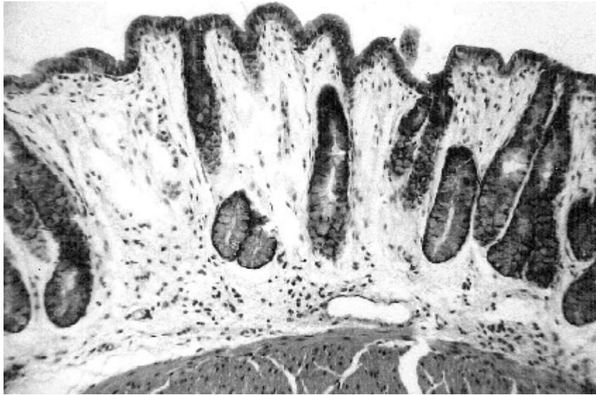
Foto 2. Grupo 3. Edema de la túnica mucosa. H.E. 200X. Photo 2. Group 3. Mucosal edema. H&E. 200X.