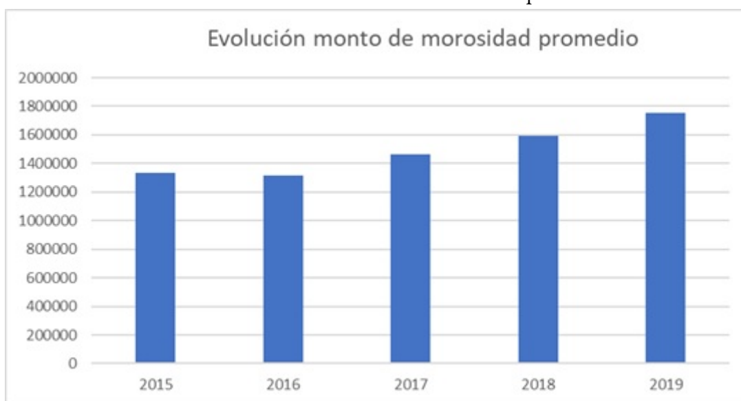
Gráfico 3. Evolución del monto de morosidad promedio.

Elaboración propia en base a XXIV encuesta de deuda morosa USS-Equifax (2019)