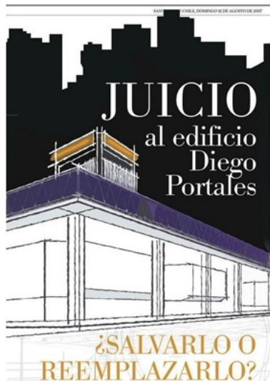
FIG. 1 Titular periódico El Mercurio 12 de agosto de 2007

En ese entonces, Javier Rojahelis, columnista del diario El Mercurio , en su sección de Arquitectura, organizó y compiló los testimonios de varios arquitectos para realizar el juicio al edificio Diego Portales: