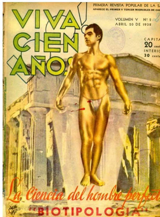
Figura 2. “El hombre perfecto propugnado por la Biotipología”, Tapa de la revista de divulgación de temas de salud, Viva Cien Años , 20 de abril de 1938.

La imagen así condensaba un implícito reforzamiento a la división de roles de género, que interesaba especialmente a los biotipólogos: la confusión de esos roles, como la desequilibrada mezcla de los temperamentos hipocráticos, producía enfermedad.