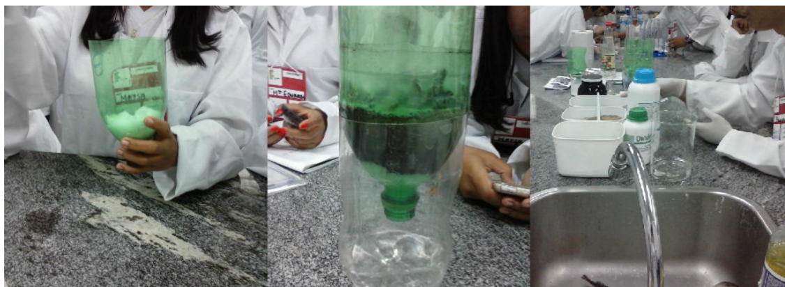
Figura 5 – Preparando o filtro de purificação da água.

Outro problema discutido pelos estudantes foi em relação aos processos envolvidos no tratamento da água. Os conceitos a cerca dos métodos de separação de misturas que são utilizados nas estações de tratamento (ETA) podem ser discutidos experimentalmente. O problema era: “qual o processo que a água passa até chegar a nossa casa?”. A questão envolvia a produção de um filtro a partir de garrafa de refrigerante vazia e alguns componentes que em camadas auxiliariam na purificação da água, tudo visando simular o processo de filtração para tratar a água. A figura 5 apresenta os alunos montando o filtro.