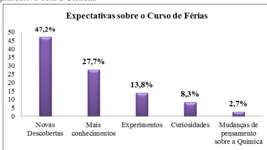
Figura 1 - Gráfico com as expectativas dos alunos sobre o Curso de Férias.

A notória expectativa a cerca das novas experiências evidencia que a proposta diferenciada motiva os alunos a participarem de atividades alternativas, que despertam o interesse pela Ciência. A cerca do uso de novas metodologias no ensino, Laburú (2006) afirma que existe uma “relação de dependência entre estratégias eficientes e a capacidade das mesmas em potencializar a motivação de grande parte dos alunos”. A figura 1 demonstra através do gráfico, as opiniões dos alunos sobre a semana que passariam fazendo experimentos e em contato significativo com a Ciência.