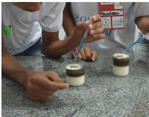
Figura 4 – Momento da prática “café com leite”.

promover a tensão superficial entre os líquidos, e assim esses não iriam se misturar. Esse momento é apresentado na figura 4.