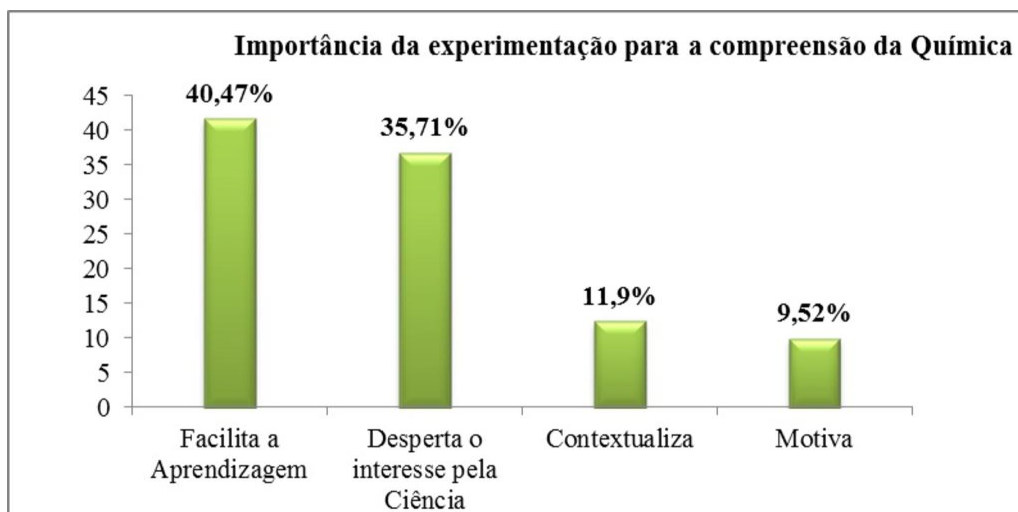
Figura 6 – A visão dos alunos a cerca dos experimentos.

gráfico dos aspectos pertinentes à experimentação para a aprendizagem da Química, de modo significativo observa-se que atividades como essa desenvolvida motiva os alunos e auxilia na aprendizagem de conceitos químicos, a partir da contextualização.