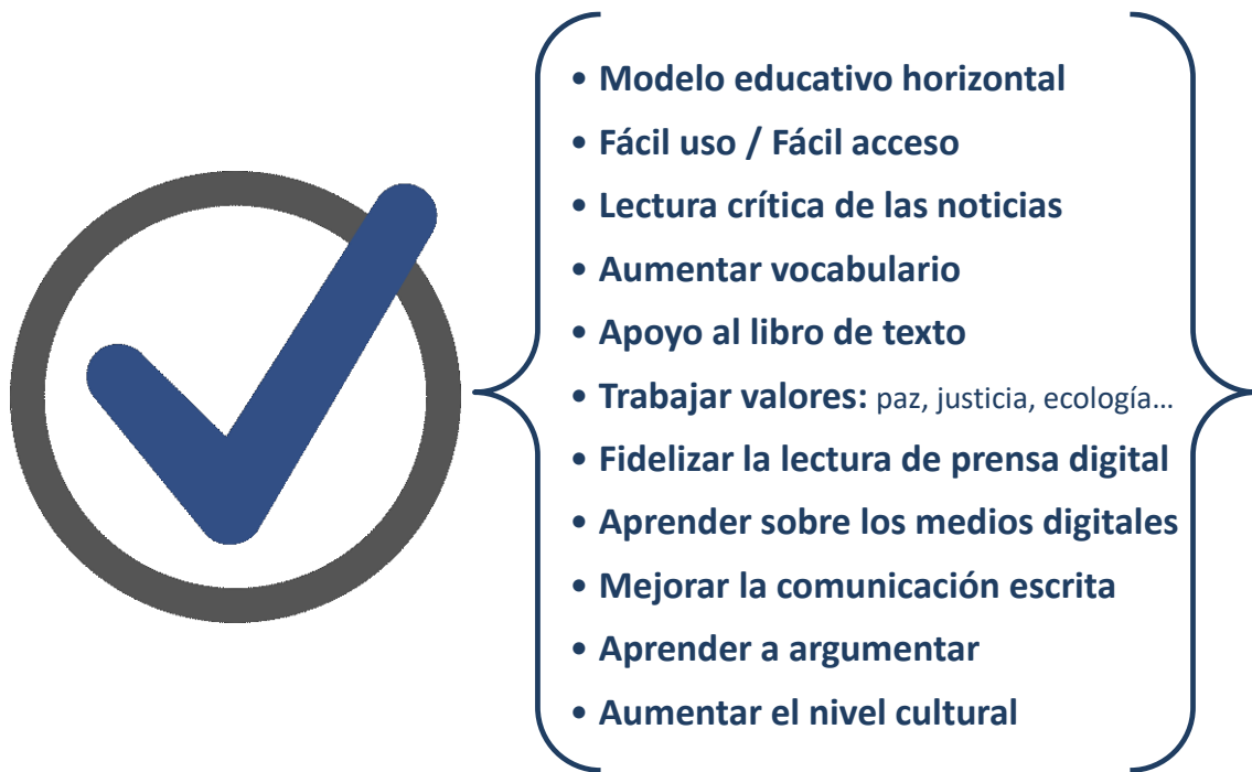
Figura 1: Ventajas del uso de la prensa digital en la educación.

Igualmente, existen desventajas y riesgos. Así pues, las actividades o proyectos educativos con la prensa digital requieren de equipos informáticos y del acceso y manejo de las herramientas adecuadas: ordenadores, conexión a Internet y navegadores. Si se trata de poner en marcha una publicación escolar en la Red, también es necesario disponer y tener conocimiento de editores de imágenes, procesadores de texto, y programas o gestores de contenidos para el diseño de la web y el mantenimiento de la página: WordPress, Blogger, Edublogs, etc. Otro requisito es la formación específica del profesorado, porque con esta alfabetización: mediática, tecnológica y social, aprenderá a aplicar las