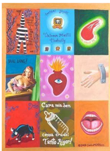
Políptico Trifásico – Carla Molina Holmes