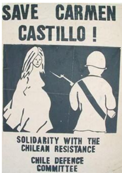
Comité Internacional de Solidaridad con Carmen Castillo