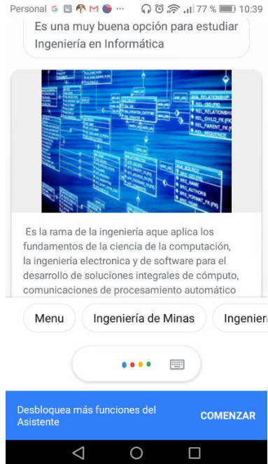
Fig. 3. Intención Solicitar información de una carrera en particular