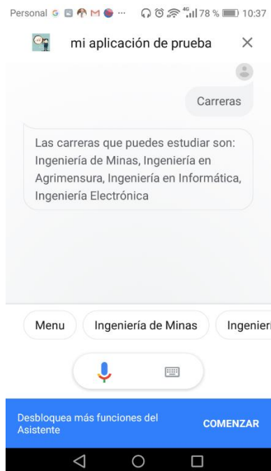
Fig. 2. Intención carreras