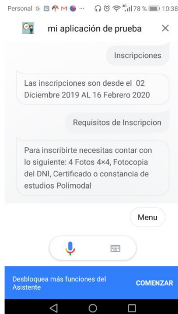
Fig. 4. Intenciones Inscripción y Requisitos