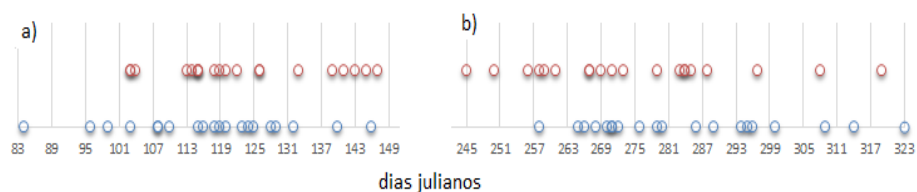
Figura 2. Distribución a lo largo del año de fechas de ocurrencia de: a) primera helada y b) última helada, en la localidad de Anguil. Los puntos de la parte superior corresponden al periodo 2000-2019, los puntos de la parte inferior al periodo 1980-1999.