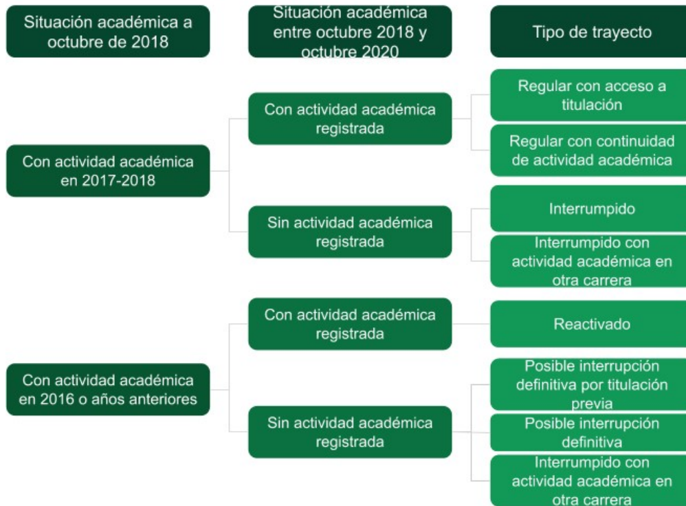
Diagrama 2. Esquema para el análisis de movilidades