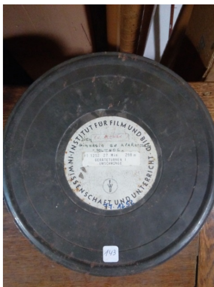
Imagen n° 1. Fotografía de la lata identificada con el número 143

manuscrita en español “DIEM, Gimnasia en aparatos – volteos”. En la misma se observa niños, niñas, hombres y mujeres realizando ejercicios en barras. Resulta interesante destacar que todas las personas que participan de la filmación llevan la misma vestimenta: en el caso de niños y los hombres adultos con el torso desnudo y pantalones claros, mientras que las niñas y adolescentes con remera blanca y pantalón negro, las mujeres con mallas enterizas color claro. A su vez, en todos los casos se trata de actividades físicas desarrolladas en un lugar cerrado, como un gimnasio, con implementos, como sogas o barras, cuestión que es característica del modelo alemán de gimnasia.