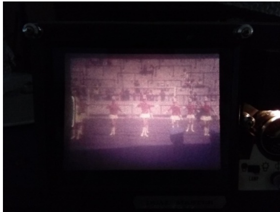
Imagen n°2. Fotografía del telecinado de la cinta identificada con el número 154

cámara, dan la impresión de ser una filmación no-profesional, aunque si oficial: las tomas cinematográficas desde distintos ángulos, la cercanía con los jefes militares presentes e incluso la filmación desde el césped donde se desarrollan las formas gimnásticas dan a la idea de un acceso autorizado.