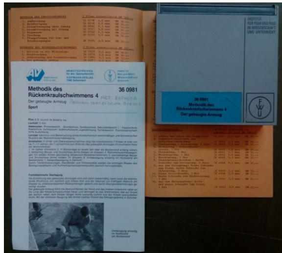
Imagen n° 7. Catálogo, instructivo y contenedor de una película de la Serie WFU

A partir de la identificación de algunas películas mediante este procedimiento, se avanzó con la modificación del listado original, se procedió a realizar una descripción documental con mayor profundidad y permitió evaluar el valor explícito e implícito de estos documentos. Por ejemplo, una de las identificadas corresponde a las Liniadas de 1949. Si bien a priori esta filmación resultaba de particular interés y valor por su contenido y su antigüedad, encontramos en la plataforma Youtube una película de este evento. 5 De esta forma, queda para futuras etapas del trabajo archivístico e investigativo el fotografiado de más fotogramas para su comparación con esta película de libre acceso en internet. Si se tratase de la misma película, no sería prioritario invertir recursos en su restauración. Sin embargo, su valor como documento es significativo, en tanto esa película forma parte de la historia de la Educación Física argentina por el hecho de estar en nuestro país y pertenecer a alguien que le dio algún uso en un determinado momento, en este caso particular, tal como indica el rótulo de la lata, fue enviada al profesor Leandro Madueño. 6 En este punto, consideramos, se hacen visibles las múltiples