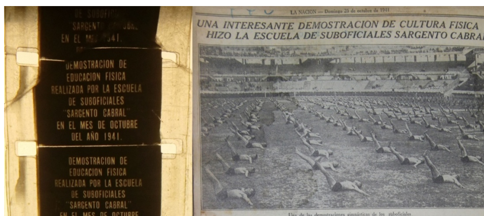
Imagen n° 5 y 6. Fotografías de la cinta cinematográfica de la película N° 113 y del Diario La Nación del 26/10/1941: “Demostración de Educación Física realizada por la Escuela de Sub Oficiales ‘Sargento Cabral’

fechada el día 26 de octubre de 1941 titulada “Interesante demostración de cultura física hizo la escuela de suboficiales Sargento Cabral” (La Nación, 26/10/1941). Este artículo hace referencia a la Fiesta de la Educación Física realizada ese año, y que señala que “Un agradable efecto produjo en la concurrencia la aparición de los atletas, que como única indumentaria usaban un pantalón corto y ceñido de deporte. Las piernas, pies y torso desnudos mostraban el relieve de un cuerpo bien trabajado, y la impresión que transmitieron al entrar, cantando con paso marcial al son de una canción emotiva, movió los primeros aplausos” (La Nación, 26/10/1941).