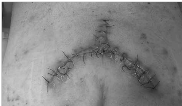
▲ Figura 8. Eritema de los bordes de la herida en un paciente con infección de sitio quirúrgico.

El tratamiento quirúrgico de los tumores sacros es uno de los grandes desafíos para todo cirujano espinal. La complejidad de la anatomía de la pelvis y la presencia de enfermedad avanzada hace que, muchas veces, se requiera de un abordaje multidisciplinario. Este procedimiento está determinado por numerosos factores, como el estado preoperatorio del paciente, las características anatómicas de la lesión, la zona del sacro comprometida y la biología de tumor en sí. Los pacientes deben ser cuidadosamente seleccionados con respecto a estos puntos, ya que las resecciones sacras son procedimientos de elevada morbi-