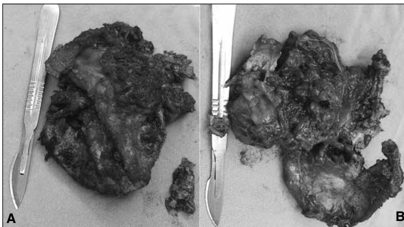
◀ Figura 5. Pieza quirúrgica de una resección en bloque del sacro, con diagnóstico anatomopatológico de cordoma. A. Cara posterior del sacro. B. Cara anterior del sacro.

el lado que tenga menor compromiso tumoral disecando recto y estructuras vasculares de la fascia presacra. Las raíces que no estén comprometidas por el tumor se deben conservar. La pieza resecada se observa cuidadosamente para evaluar partes blandas y óseas (Figura 5). Se envía para estudio anatomopatológico. En estos casos, como no existe compromiso sacroilíaco, no se realiza reconstrucción del anillo pelviano. Se efectúa un correcto desbridamiento de tejidos desvitalizados y abundante lavado, en forma periódica, con solución fisiológica durante toda la cirugía. Se cierra la herida por planos, y se deja un drenaje por 48 horas como mínimo (Figura 6). La cirugía duró aproximadamente 5 horas. Los controles posoperatorios confirman la resección de la pieza (Figura 7).