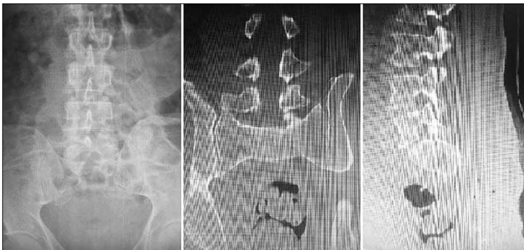
▲ Figura 7. Estudios complementarios posoperatorios donde se observa la ausencia del extremo distal del sacro por la resección quirúrgica.