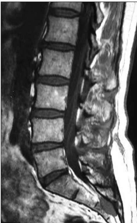
◀ Figura 3. Hombre de 49 años, que consulta por lumbalgia baja. Resonancia magnética, corte sagital paramediana T1, que muestra una lesión intracanalicular distal a S3, con expansión al cuerpo y al arco posterior. Diagnóstico anatomopatológico: metástasis única de carcinoma prostático.