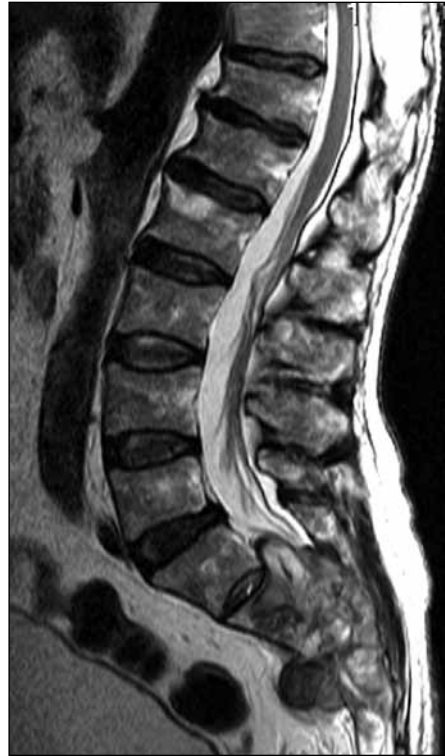
▲ Figura 2. Hombre de 65 años, que consulta por lumbalgia baja y trastornos urinarios. Resonancia magnética, corte sagital paramediana T2, que muestra una lesión que compromete las estructuras óseas a distal de S1, con expansión de corticales. Diagnóstico anatomopatológico: cordoma.