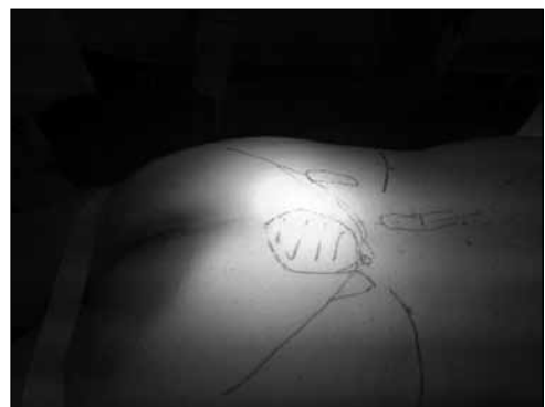
▲ Figura 4. Colocación y planificación prequirúrgicas, con marcación en la piel de la localización del tumor sacro.