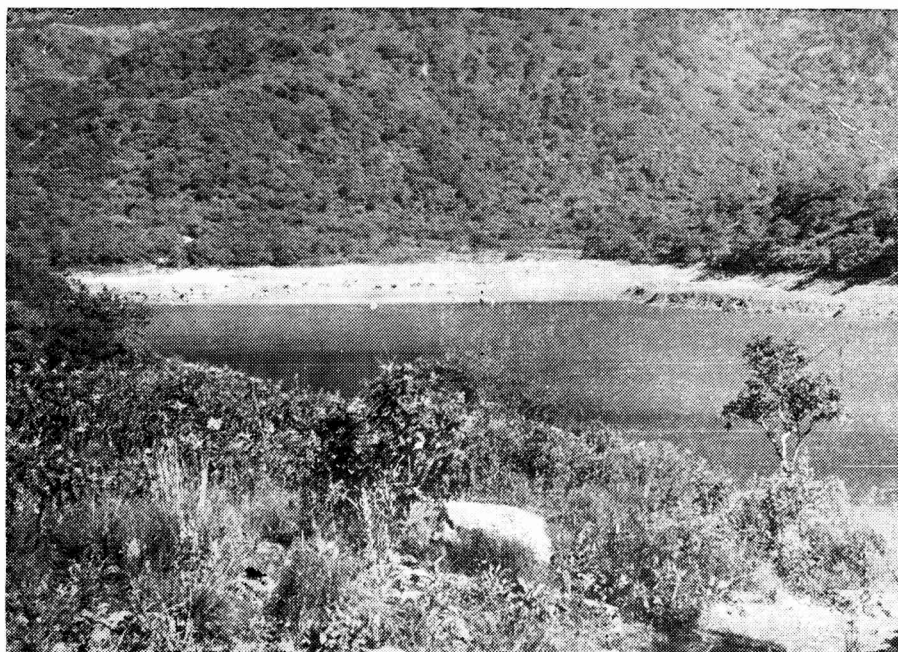
FIG. 1. Laguna El Rodeo en aguas bajas (enero 5 de 1953) vista parcial tomada hacia el N. En el primer plano bloques del arco morénico que la indica por arriba del contacto con sedimentos finos arcillosos de la morena de fondo. En segundo término a la derecha, terraza y marca de crilla de las aguas de crecidas máximas. En el frente playa con arcillas y gradas de la morena de fondo que la impermeabiliza; a la derecha, desagüe de la quebrada del Abra de Yala y a la izquierda, zanjón del desagüe del alimentador principal de la Laguna, el Arroyo torrencial de Los Tabloncs.