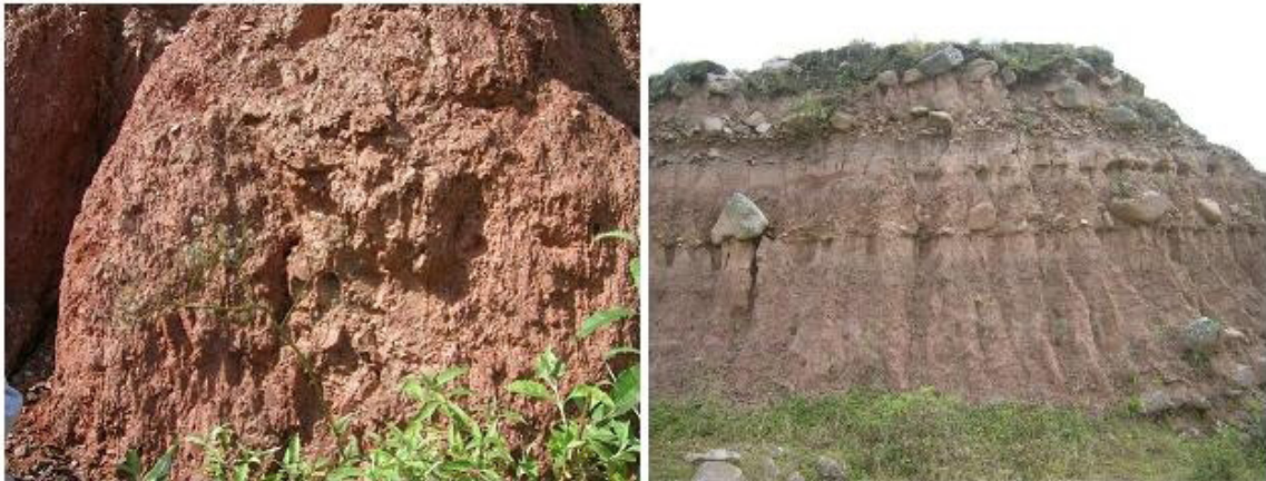
Figura 2. Derecha: Depósito arcilloso asociado a la zona de movilización del basamento metamórfico de donde se obtuvo la M3. Izquierda: Paleosuelo del perfil La Bolsa, del cual proceden las muestras M7, M8, M9 y M10.

Figure 2. Right: Clay deposit associated with the mobilization zone of the metamorphic basement from which the M3 was obtained. Left: Paleo-soil of the La Bolsa profile, from which samples M7, M8, M9 and M10 come.