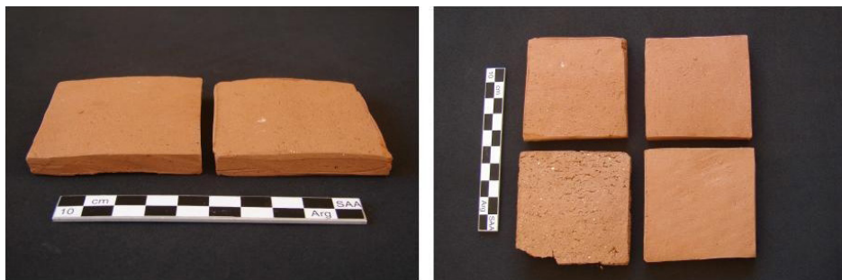
Figura 3. Briquetas experimentales con 4 de las arcillas muestreadas y analizadas.