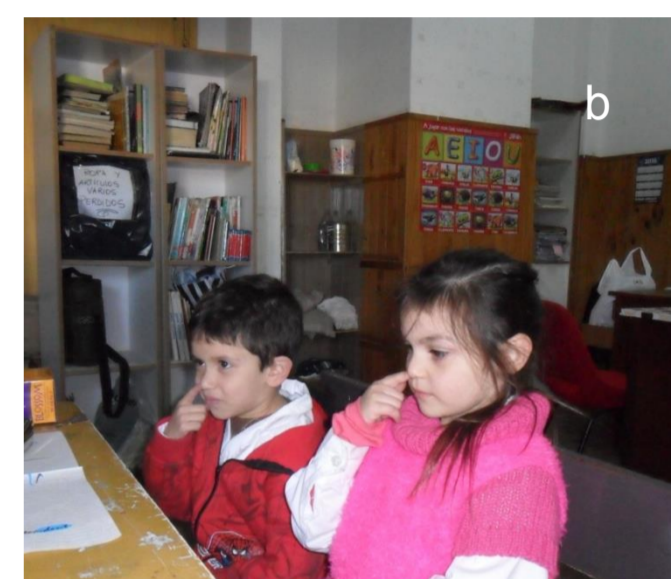
b. Prueba de Rosenthal