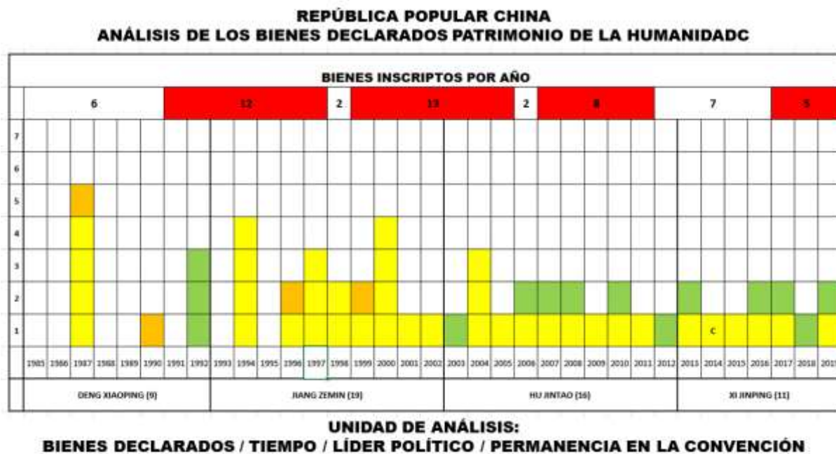
Imagen 3. Análisis de los sitios declarados en las diferentes administraciones. En rojo, los años como mandatario en la Convención, en amarillo los sitios culturales, en verde los naturales y en naranja los mixtos.

La República Popular China lleva 34 años de permanencia en la Convención del Patrimonio Mundial y ha sido cuatro veces mandataria (1991-1997; 1999-2005; 2007-2011 y 2017-2021), con un corpus normativo que está conformado por 19 leyes nacionales del patrimonio cultural que van desde el año 1935 hasta el 2007 8 ha sostenido, como puede verse en el siguiente gráfico, una política cultural de inclusión sostenida en el listado de sitios como Patrimonio de la Humanidad, sean éstos culturales, naturales, o mixtos y de los cuales ninguno se encuentra en riesgo.