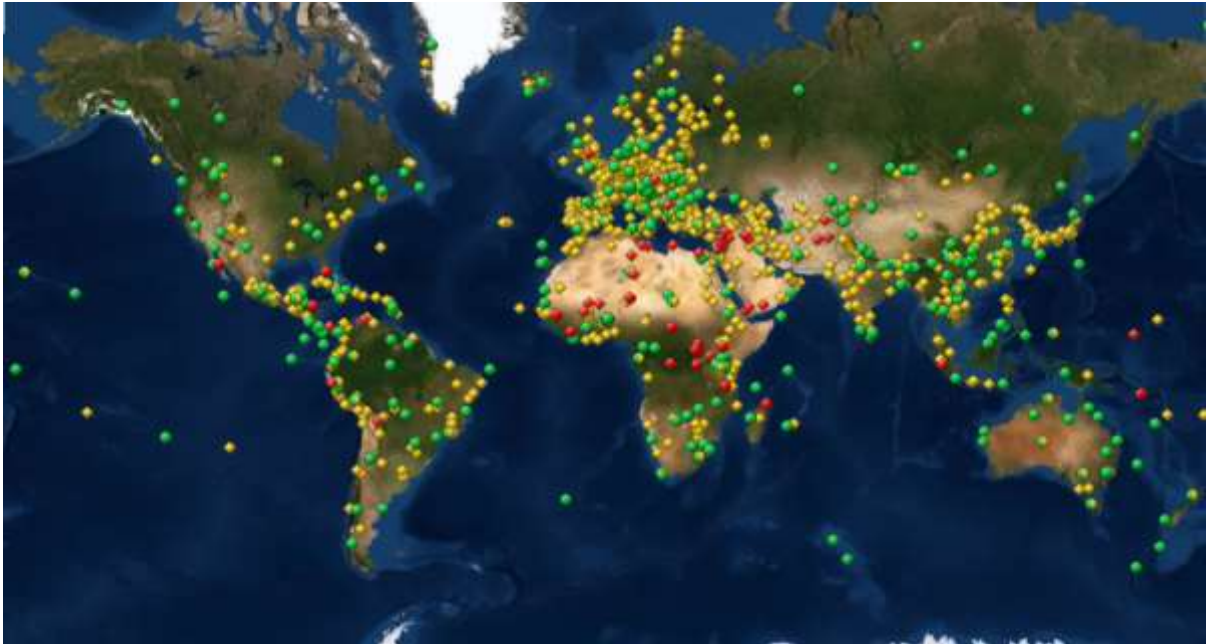
Imagen 1. Mapa mundial de los sitios declarados Patrimonio de la Humanidad: En amarillo, los sitios culturales, en verde los naturales, en verde y amarillos los mixtos y en color rojo los que están en riesgo.