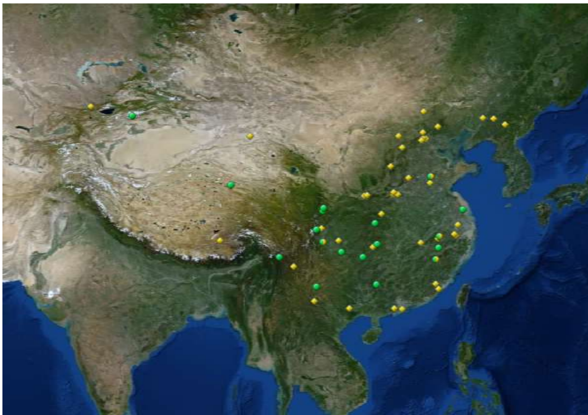
Imagen 6. Ubicación geolocalizada de todos los sitios declarados Patrimonio de la Humanidad situados en la República Popular China. En Amarillo, los culturales, en verde los naturales y en verde amarillo los mixtos. Nótese que los más dispersos (a la izquierda) corresponden a la Ruta de la Seda presentada conjuntamente con otros países.

Al iniciar un análisis más exhaustivo del patrimonio mundial chino, tanto declarado como tentativo en primer lugar, es posible reconocer un gran desbalance al geolocalizar cada uno de los sitios en el territorio chino, puesto que más del 85% de ellos se encuentran ubicados en la próspera costa sudeste del país. Esta primera aproximación geográfica está asociada con las ciudades y lugares naturales más antiguos, densamente poblados y prósperos de China en toda su extensión.