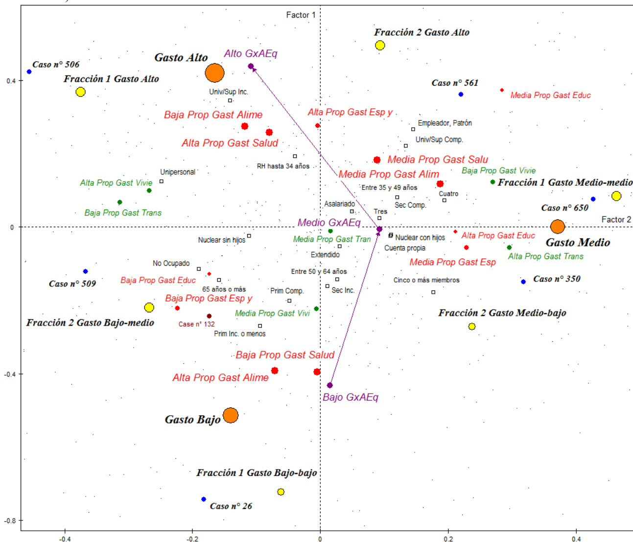
Diagrama 1: La estructura del gasto de los hogares cordobeses. 1° y 2° factor (79,3% de inercia)

Todo parece indicar que este primer factor se ordena conforme al volumen del gasto total y así decidimos mostrarlo en el diagrama a través de la línea que une las categorías de esa variable. Expresando el 63,3% de la inercia total (siempre a partir de la corrección de los