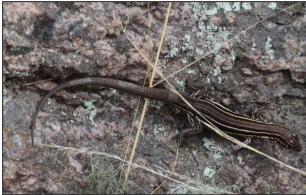
Figura 3. Contomastix serrana fotografiado el 11 de Enero de 2014 en Puesto El Moyaco, Sierra de los Quinteros, cercanías de la localidad de Las Higueras.

de seis nuevas especies para la provincia desde la publicación de Cruz et al. (2012), Sin embargo, es posible que en el futuro próximo nuevas especies se añadan a la fauna de la provincia dada la amplitud de ambientes inexplorados y la ausencia de censos exploratorios en los más conocidos. Una muestra de ello es el registro fotográfico de un ejemplar de Contomastix serrana (Fig. 3) en ambientes de Chaco Serrano, en la localidad de Puesto El Moyaco, Sierra de los Quinteros, cercanías de Las Higueras 30,5903° S, W 66.3703° O, 1420 m s.n.m. Esta especie no fue nunca observada en el Chaco árido circundante a la Sierra de los Llanos, pero es común en ambientes de Chaco Serrano en las cercanas Sierras de Córdoba y San Luis (Martori y Aun, 1995; Perez et al. , 2004).