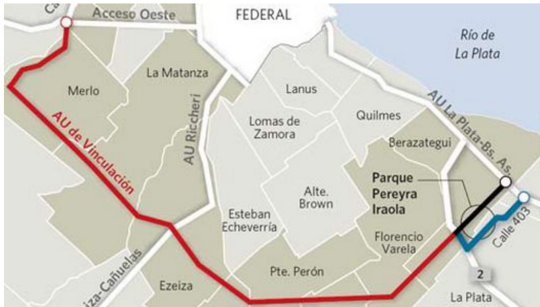
Primer y segunda alternativa para el Tramo IV de la Autopista Presidente Perón. La segunda traza presentada por la Dirección Nacional de Vialidad, propone conectar la Ruta 2 con la Autopista Buenos Aires-La Plata, construyendo el enlace vial sobre la calle 403 de la localidad de Villa Elisa. Fuente: sitio web Vecinos Autoconvocados de Villa Elisa. Fuente: vecinosvillaelisa.wordpress.com. Consultada: 15-03-1012.