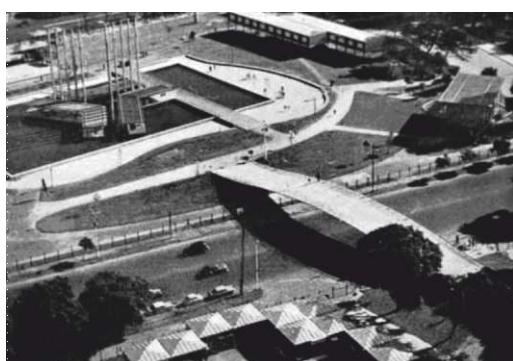
Fig. 8. El puente de César Jannello en su emplazamiento original en la Feria de 1960. (Muzi, C. (2011). A city, a bridge, a chair. On the trail of César Jannello. Art Nexus Magazine , 82)

Sin embargo, en 1974, con el avance de los preparativos para la construcción del Altar de