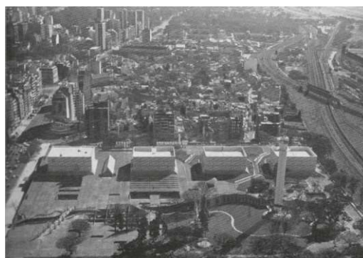
Fig. 2. Vista aérea del Centro de Producción Buenos Aires y su entorno (1978. Summa, 127)

por la avenida Figueroa Alcorta, las calles Tagle y Austria y las vías del ferrocarril Mitre. No se llamaba Argentina Televisora Color, ni aún Canal 7. 2 Su construcción fue veloz, en sólo 18 meses, entre 1977 y 1978, con un comitente apremiado por la televisación a color del encuentro futbolístico que se realizaría en nuestro país en junio de 1978 y que la Junta Militar pretendía utilizar para mejorar su imagen ante la supuesta campaña antiargentina que se estaba desarrollando en el exterior. Se trataba, en realidad, de las denuncias sobre las violaciones a los derechos humanos que habían comenzado a circular cada vez con mayor fuerza y que obligaban al gobierno militar a una respuesta defensiva, a acciones de propaganda que mostraran al país pacificado y en armonía.