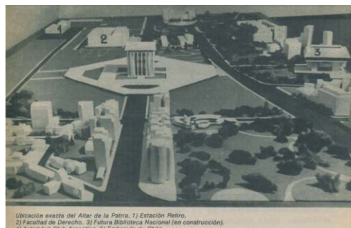
Fig. 3. Maqueta con el emplazamiento del Altar de la Patria sobre la avenida Figueroa Alcorta (1974, abril. Revista Las Bases , 89)

La revista Las Bases 34 publica en abril un artículo: Altar de la Patria: monumento sin tiempo. El altar es comparado en esas páginas con los monumentos más importantes de Europa y se justifica su construcción como símbolo de la recuperación de la unidad