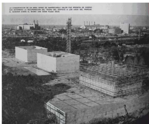
Fig. 1. El edificio del Centro de Producción Buenos Aires en construcción (1977, noviembre-diciembre. Revista Construcciones, 268)

El Centro de Producción Buenos Aires (fig. 1 y 2) había sido levantado en el predio limitado