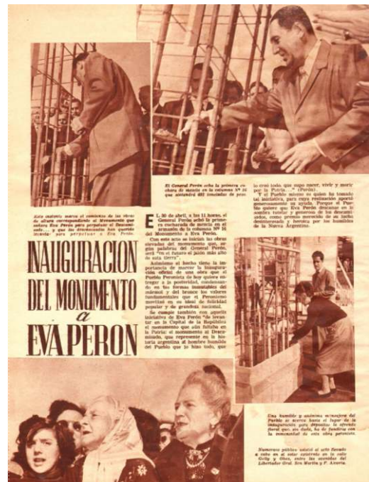
Fig. 6. Inauguración de las obras del Monumento. El presidente J.D. Perón echa la primera cucharada de mezcla en una de las columnas. (1955. Mundo peronista, 86)

Monumento en su memoria que tendría por figura central un descamisado de proporciones colosales y que comenzó a construirse en abril de 1955 (fig. 5 y 6). Luego de descartar la Plaza de Mayo y también la intersección de 9 de Julio y Avenida de Mayo, la decisión había sido finalmente emplazarlo en un predio cercano al Palacio Unzué, en Libertador y Austria, por entonces residencia presidencial y último lugar de descanso de Eva Perón. 42 El proyecto del 74, que ante todo motorizaba el ministro López