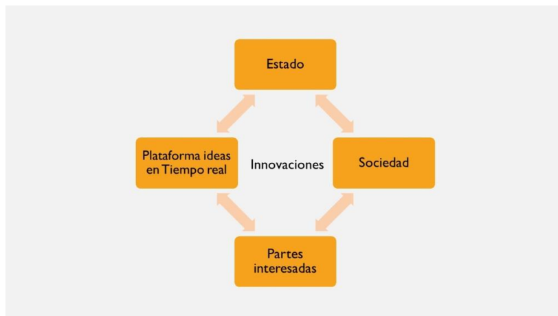
Fig.2 Formas organizacionales de creación y uso del conocimiento tecnológico

En “Closed or open innovation? Problem solving and the governance choice” [18], proponen abarcar los procesos de innovación desde una perspectiva que se enfoca en la gestión del conocimiento vinculando “el problema a resolver con una forma de gobierno determinada (gobernanza)” que pivotea entre innovación abierta o cerrada y soporta distintas formas para la búsqueda de soluciones. Es decir, la incertidumbre y complejidad de los procesos de innovación junto a la posibilidad de combinar conocimientos ha llevado a una situación donde las instituciones se hacen más permeables e interactúan con otros actores de manera más abierta y sistémica. La forma en que se genera esta interacción y el problema a resolver va a determinar una forma de gobierno –estructura– por sobre otra. Como se muestra en la Fig.2 se muestra la gestión de Innovaciones donde interactúan en la Plataforma Ideas en Tiempo Real: El Estado, la sociedad a través de sus comunidades y redes de innovación, las partes interesadas ya sean particulares, Empresas y Administración.