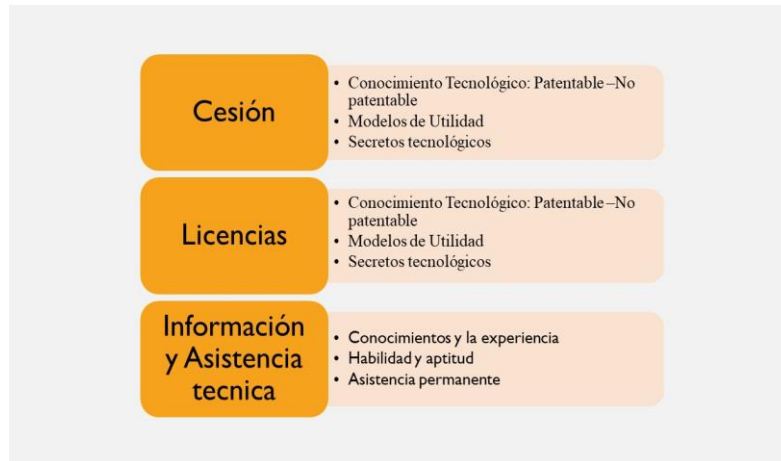
Fig.3 Contrato de transferencia tecnológica

Resulta claro que la creación de una idea en el contexto de la plataforma ideas en tiempo real, es una producción intelectual, siendo las ediciones en la plataforma digital, su forma de expresión. Si bien lo anterior no resulta problemático a simple vista, la naturaleza de la producción intelectual multiautoral en las ideas/proyectos dificulta el ejercicio de los derechos que emanan de esta protección. Recordemos que, en este tipo de obras, múltiples usuarios pueden intervenir los contenidos de manera simultánea, no existiendo una exigencia cualitativa o cuantitativa de sus aportes. El Convenio de Berna establece en su art 2º, que dentro de las obras protegidas por éste están las «producciones en el campo literario, científico y artístico, cualquiera que sea el modo o forma de expresión» [24].