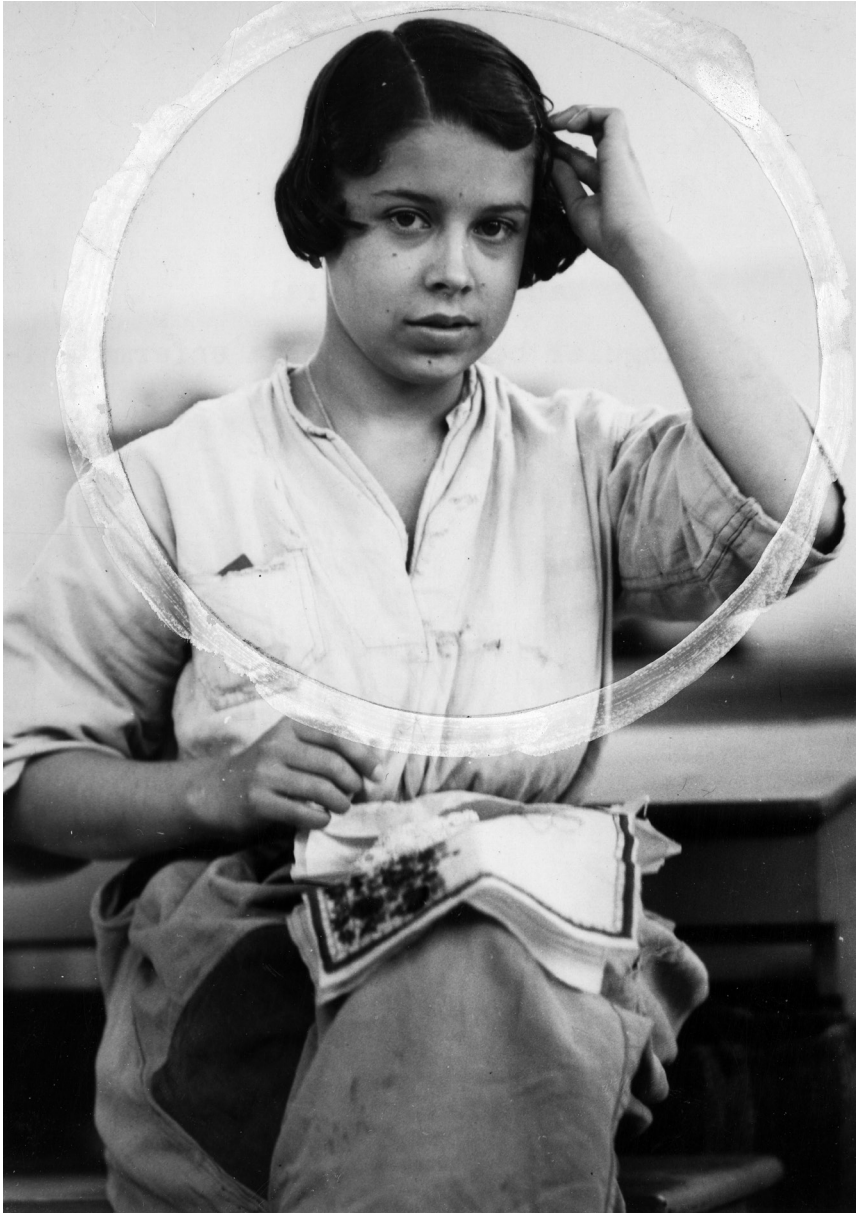
"Enferma epiléptica" (impresión plata sobre gelatina entonada y manipulada: 12.7 x 17.8 cm.), México, D.F. c. 1935-1937.