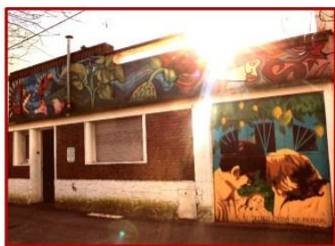
Casa El Bichicuí

Las representaciones sociales en torno al patrimonio y los sitios de memoria. El caso de los sitios “Mariani-Teruggi y “El Bichicuí” de la ciudad de La Plata.