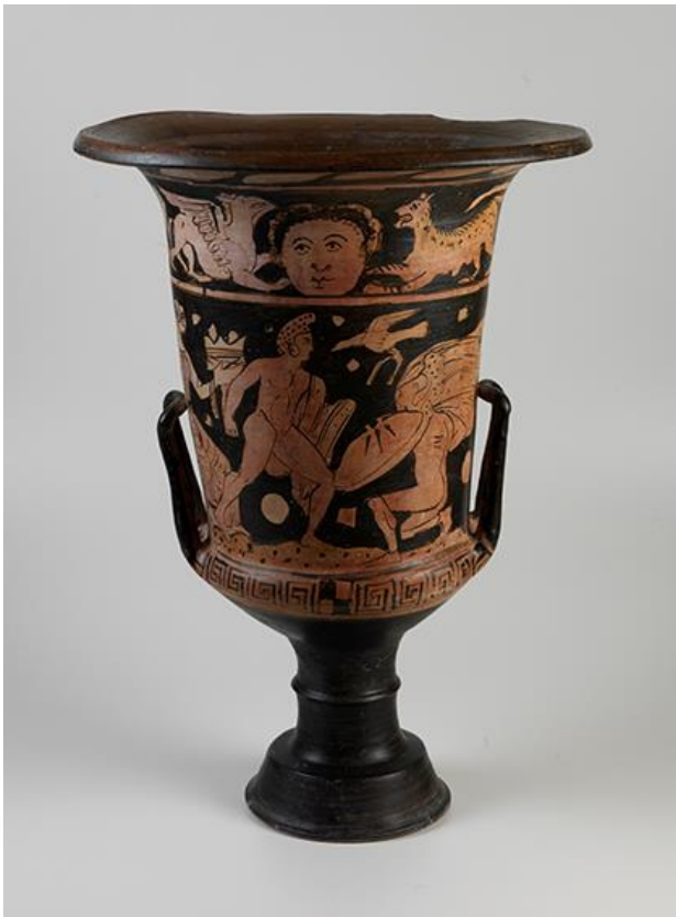
Image1 1: Crátera en Cálice, Italiota. Siglo IV a.C. Italia Meridional, Campânia. La escena representa el combate entre los dos guerreros Etéocles y Polinices. Un pájaro entre ellos lleva una cinta de victoria (tenia). A la izquierda, una mujer sentada sostiene una bandeja de ofrendas. En la decoración superior, una cara frontal femenina está flanqueada por un grifo y una pantera. Estos se usaron para mezclar agua y vino, dependiendo de la ocasión y la necesidad.

vino, Imagen 1), las copas (para vino, Imagen 2), los enocoas (para vino) y los psícteres (para vino). Estos, a su vez, estaban cargados de pinturas, con temas típicos de banquetes, escenas deportivas, escenas homéricas, dioses y otros motivos mitológicos. En la ilustración de los vasos tenemos, fuertemente presentes, elementos de la cultura griega difundidos por sus regiones de influencia.