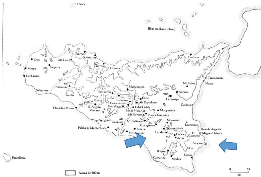
Imagen 3: Mapa de Sicilia donde se destacan (nuestra edición) las ciudades comentadas cerca del origen de Arquéstrato (Hirata, 2009, p.123).

elementos que pueden ser importantes para entender la comida griega en el contexto en el que escribe Arquéstrato.