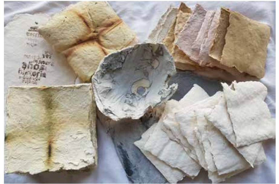
El papel arde en el horno, y al arder deja su impronta transformada en ceniza.