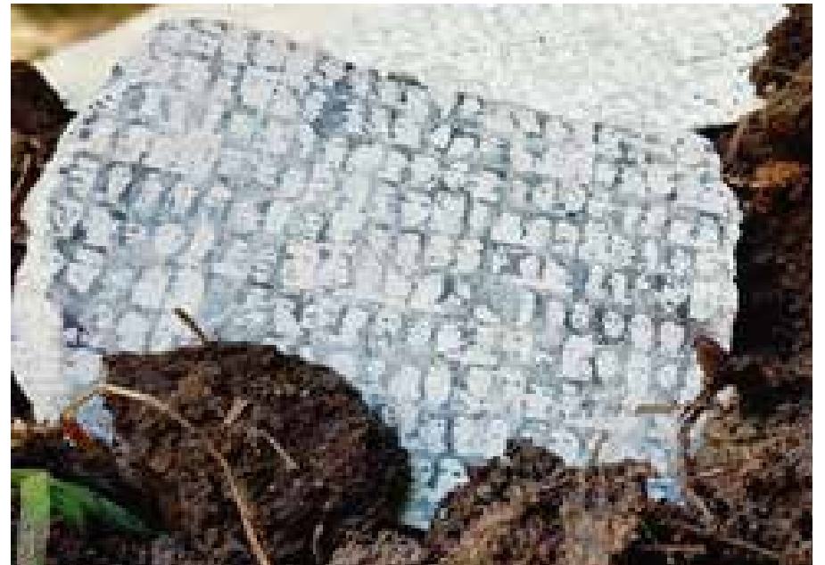
Transferencia de trama e inciso grabado sobre placa horneada de Paper Clay .