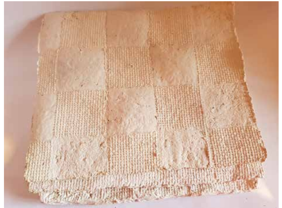
Tratamiento de superficie con impresión de textura.