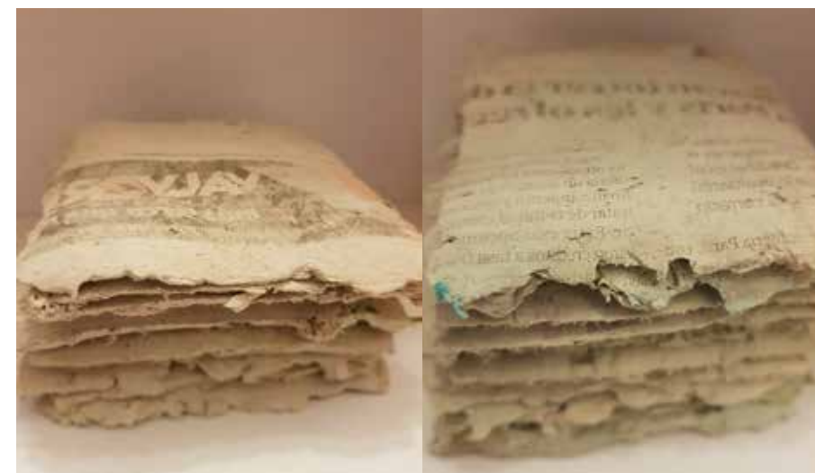
Láminas secadas sobre papel de diario sin hornear

Pasta que resulta de mezclar papel hidratado con arcilla en distintas proporciones, muy versátil en manos del artista que la convierte en obra.