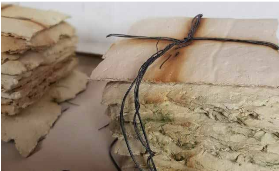
Tratamiento con alambre de óxido de cobre. Atados de memoria.