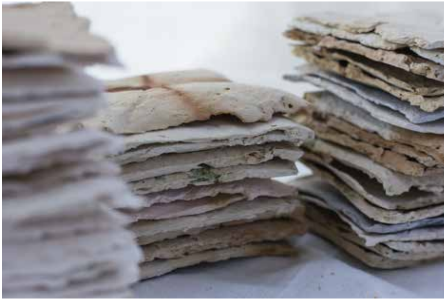
Láminas resultantes de distintos tipos de pasta; papel tisú, diario, cartón, arcilla blanca, roja, y distinta proporción de agua. Horneadas en atmósfera oxidante a 1020°C