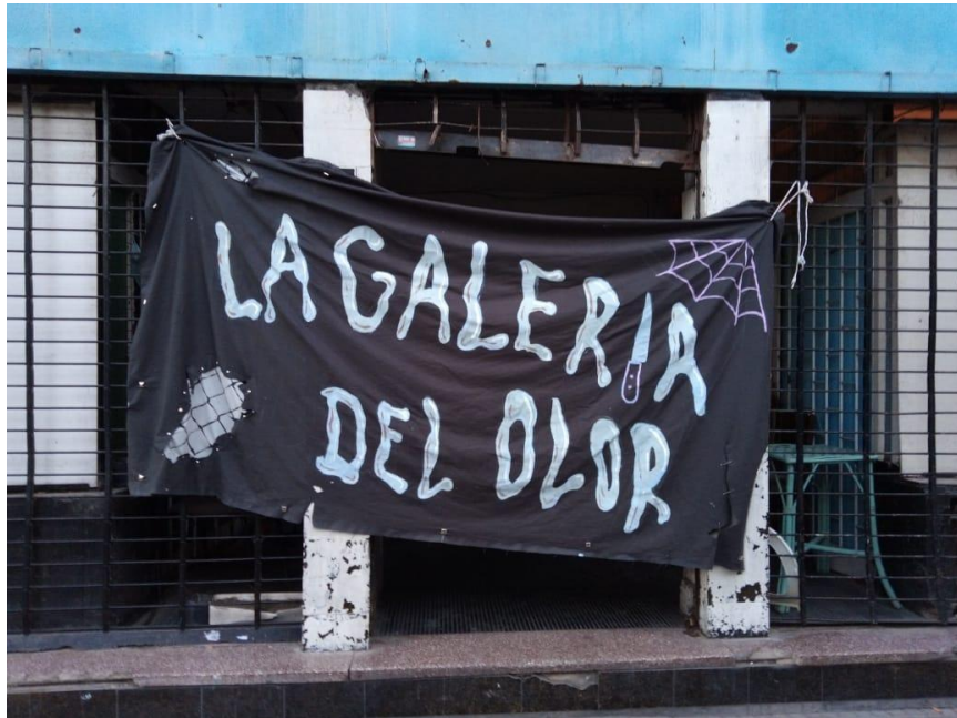
Montaje de parche La galería del olor en calle 49 entre 4 y 5. 2021