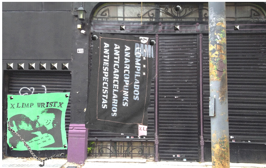
Montaje digital de parches, cadenas, tachas y arandelas en ex local El Viejo Varieté. 2020.