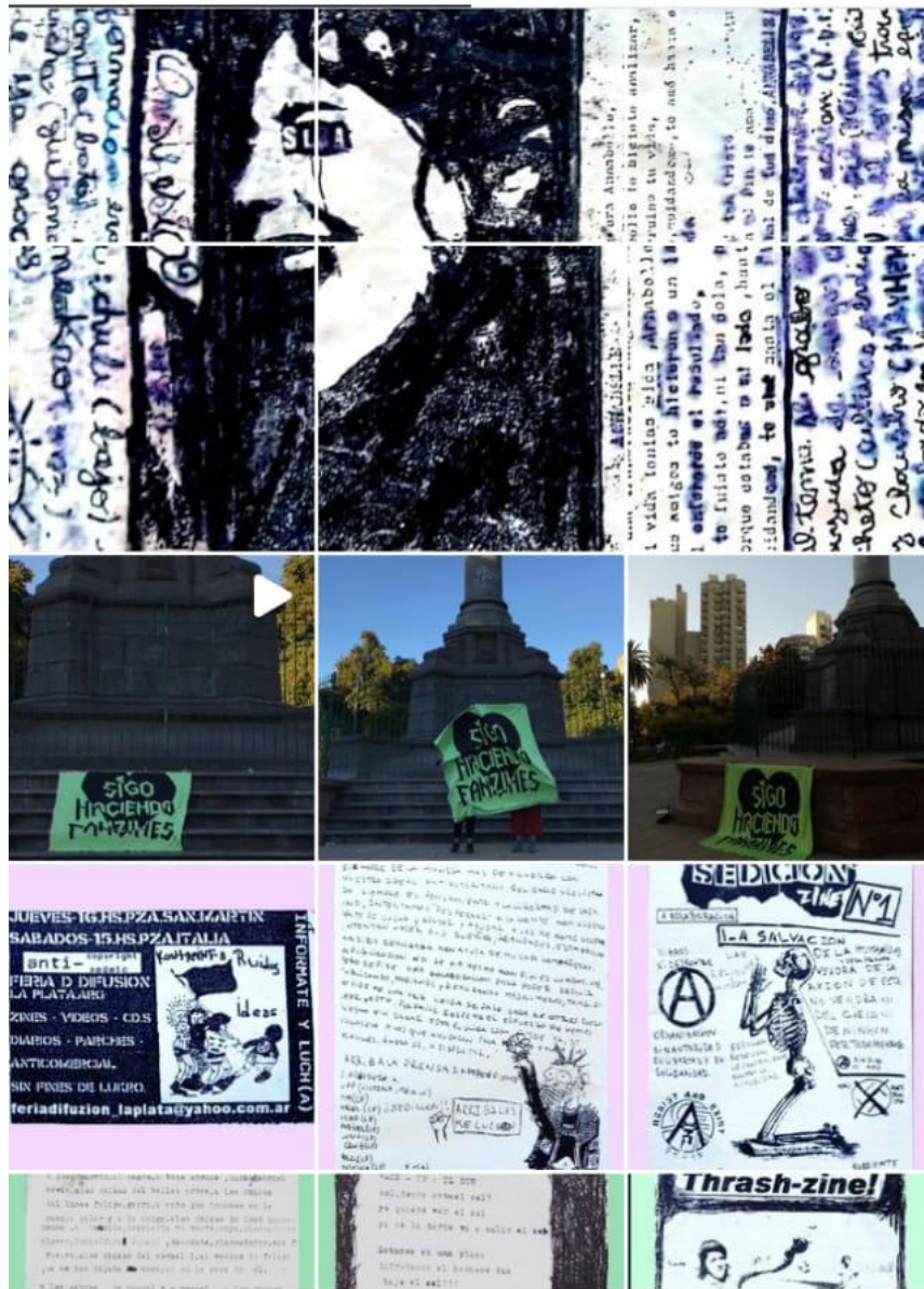
Registro del feed de la cuenta de INstagram @mimemoriaes1kaos, 2021