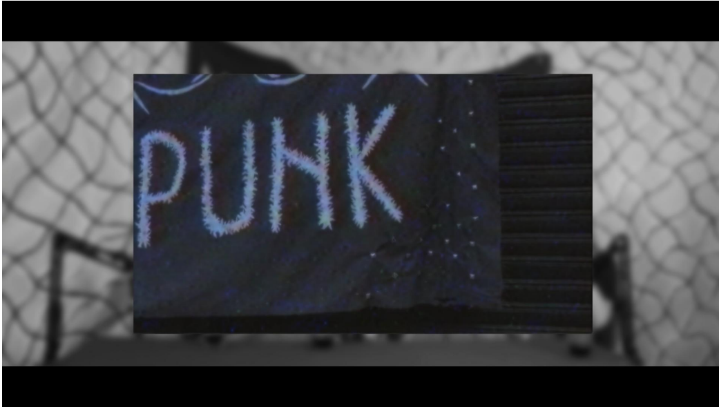
Captura de video Mimemoriaes1kaos. 2021