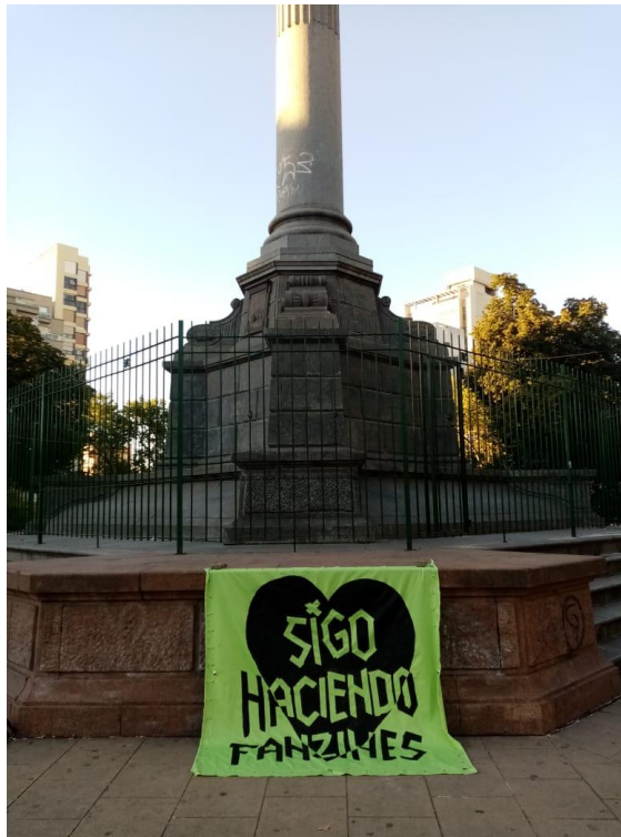
Montaje de parche Sigo haciendo fanzines en Plaza Italia. 2021