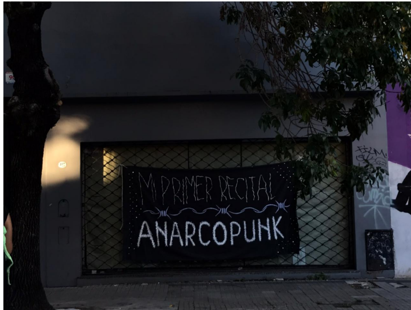
Montaje de parche Mi primer recital anarcopunk en calle 49 entre 4 y 5. 2021