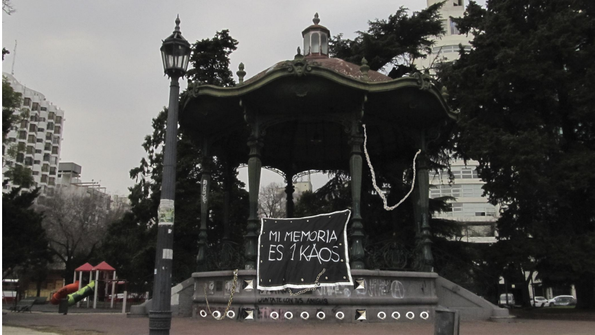
Montaje digital de parches, cadenas, tachas y arandelas en la glorieta de la Plaza San Martín. 2020