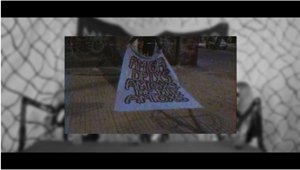
Captura de video Mimemoriaes1kaos. 2021