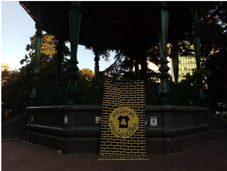
Montaje de parche Valores amistosillos en la glorieta de Plaza San Martín. .2021