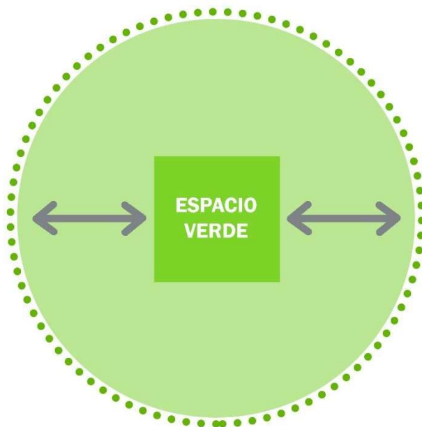
Figura 4. Radio de cobertura EVUP.