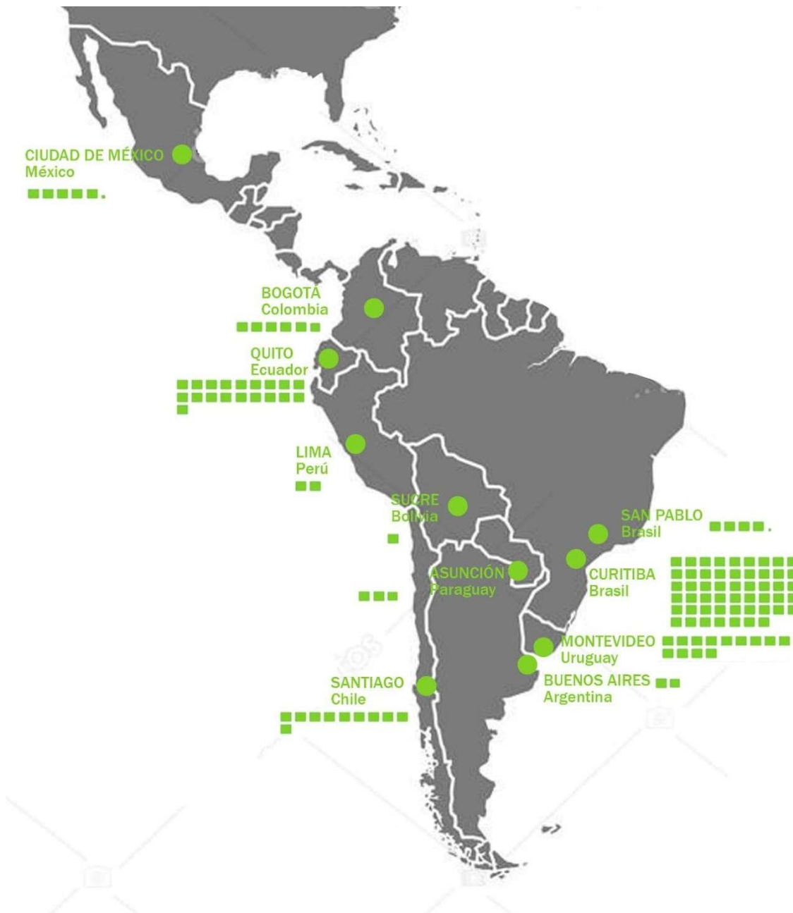
Figura 3. m 2 de espacio verde por habitante en diferentes ciudades del mundo.

Entre 5 y 10m 2 se encuentra Ciudad de México 5,3m 2 , Bogotá con 5,9m 2 y Santiago de Chile con 10m 2 . Por encima de los 10m 2 se encuentran Montevideo con 12,6m 2 , Quito con 21,6m 2 y muy por encima de esto Curitiba con 52m 2 .