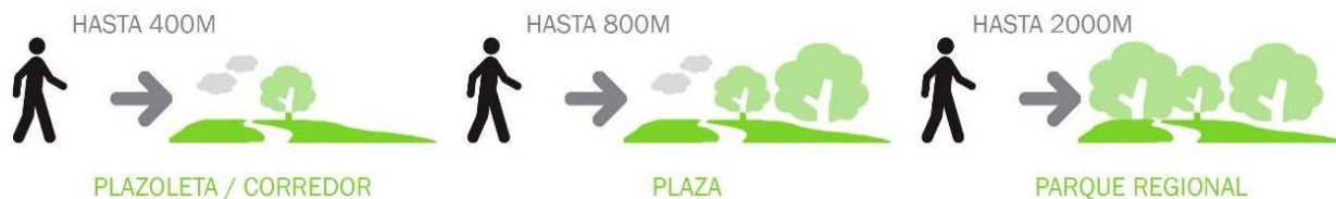
Figura 5. Radios de cobertura propuestos.