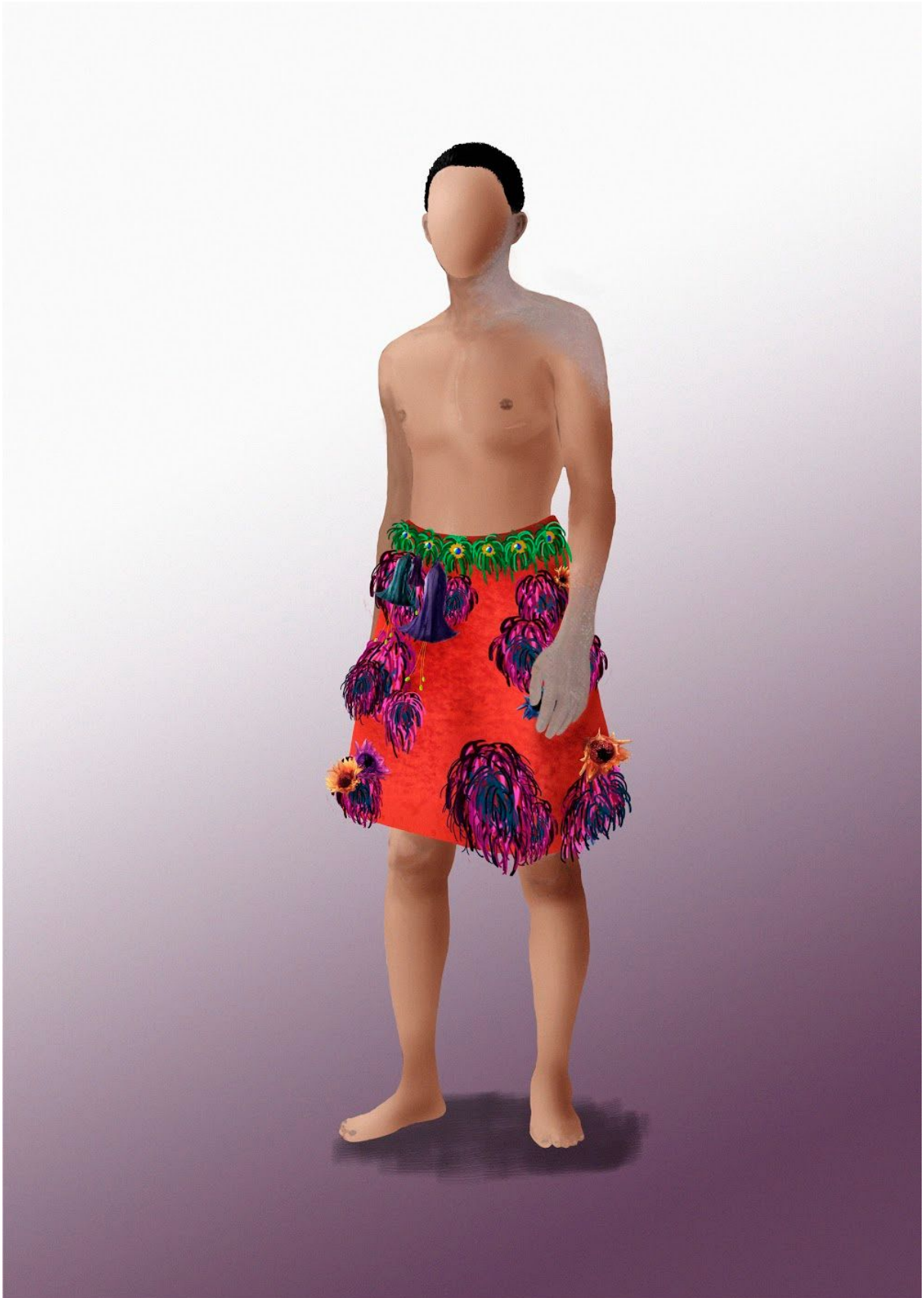
Obra: Liminal (Tesis de grado de Licenciatura en Artes Plásticas con orientación en Escenografía) Autor: Nicolas Stephano Zúñiga Vinuesa Diseño y realización de vestuario: Indira Bogado Lugar: La Plata, Buenos Aires, Argentina Fecha: 08/11/2020