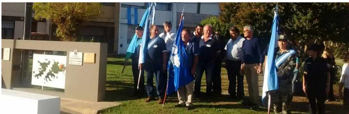
(Fotografía de un acto en el monolito al Soldado Francisquez con la presencia de los excombatientes de la ciudad)