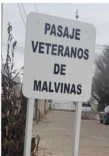
(Fotografía de la señalización de un pasaje ubicado en la intersección con la calle Gutiérrez, Nueve de Julio. Fotografía propia, agosto 2019)