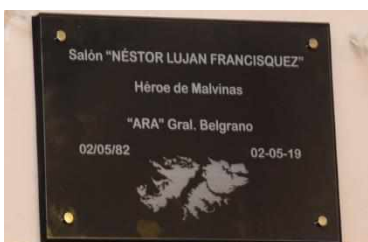
(Fotografía de una plaza incorporada en un salón de usos múltiples de una escuela de la ciudad)