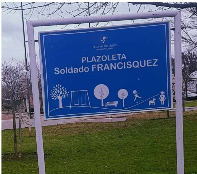
(Fotografía de señalización de una plazoleta en memoria del Soldado Francisquez. Fotografía propia, agosto 2019)