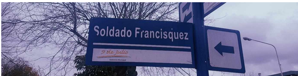
(Fotografía de la calle Soldado Francisquez en la intersección con la Avenida Tomas Cosentino. Fotografía propia, agosto 2019)