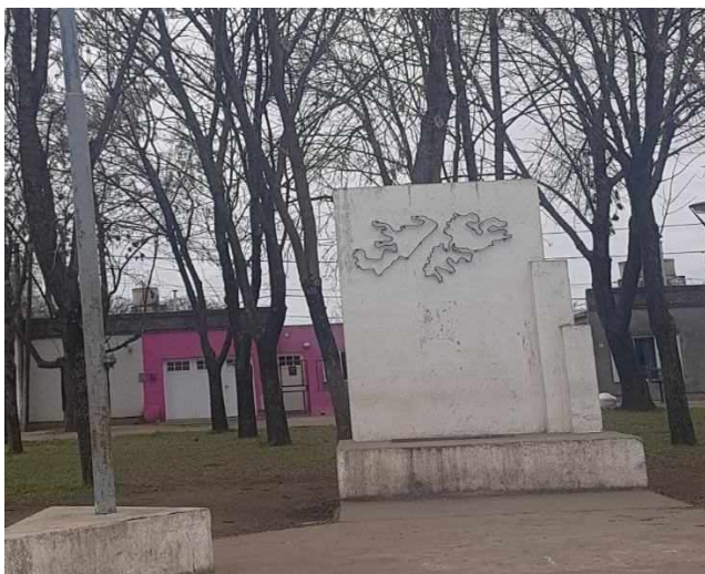
(Fotografía de un monumento de la Plaza Héroe de Malvinas. Fotografía propia, agosto 2019)