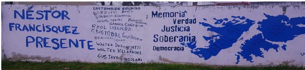
(Fotografía del mural ubicado en Avenida Almirante Brown y Mariano Moreno, Nueve de Julio. agosto 2019)