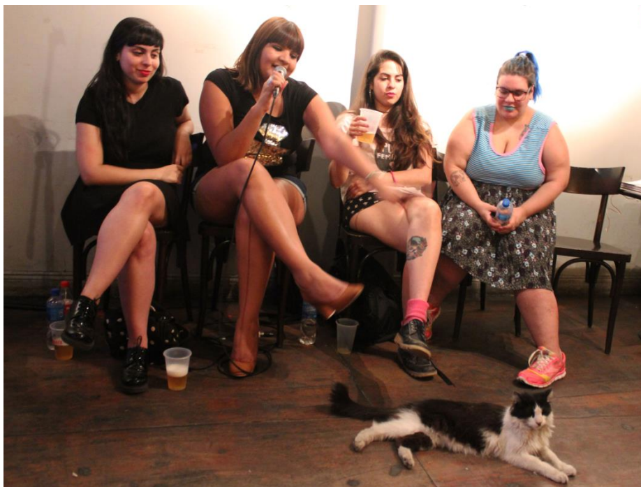
Imagen 4: Mujeres trabajadoras sexuales del sindicato AMMAR.

A partir de esta nueva visión que considera al trabajo sexual, y dentro de él a la pornografía, como un trabajo es que las y los trabajadores del rubro empezaron a organizarse en diferentes países para luchar por derechos laborales y sociales. En Argentina la Asociación de Mujeres Meretrices de la Argentina (AMMAR) es un sindicato nacional nucleado en la Central de Trabajadores de la Argentina (CTA) donde, a pesar de no ser reconocidas como trabajadoras por el Estado nacional, se organizaron para lograr visibilizar sus problemáticas y generar diálogos políticos que les permitan mejorar su situación como colectivo. El objetivo de estos nuevos discursos es claro: la pornografía (y el trabajo sexual) existe y representa un espacio donde se muestran diferentes identidades relacionadas mediante disputas de poder y, por lo tanto, ven en esos espacios la necesidad de asumirlos como propios reivindicando nuevas formas de entender el placer, el goce y la representación de esas identidades. Por este motivo se intenta encontrar un punto en el que la construcción de las corporeidades, las sexualidades y las identidades que no se ven representadas dentro del llamado porno mainstream por ser un punto de vista heterosexual, dominante y masculino, puedan tener la posibilidad de disputa. Tal es así que la post-pornografía puede ser reconocida