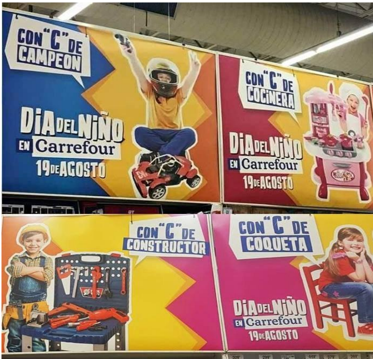
Imagen 1: publicidad del supermercado Carrefour para el Día del Niño 2018.

En el caso de la publicidad seleccionada, que se podía encontrar en los supermercados Carrefour de todo el país, se puede observar la división de géneros desde la primera infancia. Por un lado las niñas son definidas como “cocineras”, respondiendo al preconcepto que supone que las tareas domésticas dentro del espacio privado que representa el hogar deben ser realizadas por mujeres de manera gratuita y obligatoria, y a partir desde esa línea se las entrena desde el nacimiento para cumplir ese rol. Además se las define como “coquetas” que también hace referencia a la idea de pulcritud y sacralidad que históricamente se construyó alrededor de la mujer pero que con los cambios sociales mutó hasta convertirse en la idea de que la mujer debe estar arreglada, prolija, ser femenina, etc. Por otro lado, los niños son representados por la palabra “constructor” ya que ellos también son entrenados desde pequeños para que estén dispuestos a hacer tareas de fuerza donde intervenga el cuerpo, la masculinidad y siempre ligando al varón al sistema de trabajo y el espacio público. Asimismo, se lo denomina como campeón porque otra de las características de los varones para ser aceptados en sociedad es la condición de ser siempre un competidor y un ganador, convirtiéndolos en actores activos dentro de la sociedad, al contrario de la pasividad de las