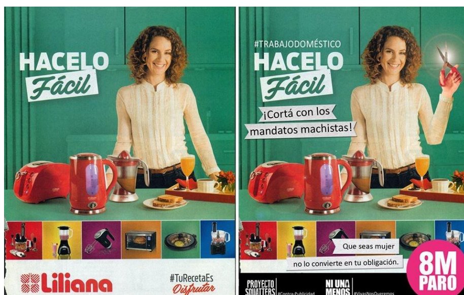
Imagen 2: Publicidad de Liliana por el Día de la Madre (2016) y crítica feminista

compradora de artículos para su uso y para uso de otros” (Blanco Castillas, 2005:51) entonces ese puede ser el motivo de por qué desde el sector de la publicidad se sigue defendiendo este modelo de organización y de relaciones sociales: es el modelo que seguirá garantizando el consumo satisfactorio que requiere el capitalismo.