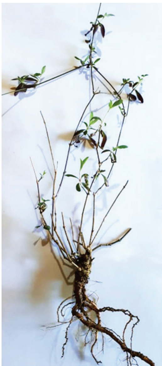
Gomphrena perennis - Planta adulta

La aplicación de las diferentes combinaciones de herbicidas, coadyuvantes y tensioactivos condujo a diversas respuestas de fitotoxicidad en los materiales evaluados (Figura 1). A los 7 DDA la mayor sensibilidad fue detectada en las plántulas de G. perennis , pertenecientes a los T3, T4, T5 y T6 (Cuadro 2). Los síntomas observados fueron la presencia de numerosas hojas totalmente senescentes, epinastia en las hojas superiores y manchas blanquecinas que posiblemente se asocien al lugar del impacto de los fitosanitarios. Las plantas correspondientes a T4 y T6 manifestaron actividad en las yemas axilares, producto del daño de la