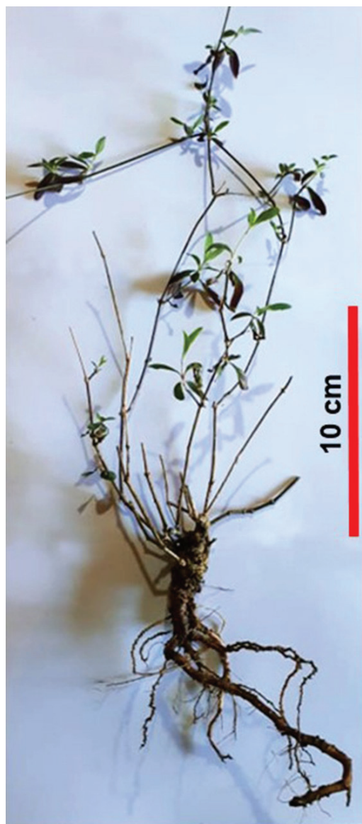
Planta Gomphrena adulta con escala